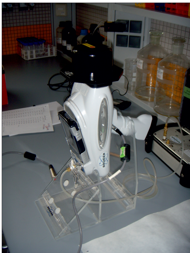
Fig. 2. Handheld XRF spectrometer with vacuum pump – a set used during the analysis of pottery from the orientaling period in the museums of Andalusia

z kolonii fenickich zachodniego Śródziemnomorza (Behrendt et al. 2012) daje możliwość korzystania z istniejącej już kolekcji referencyjnej i wiarygodnego porównania wyników. Analizy wykonane zostały przy użyciu pompy próżniowej. Używano dwóch kalibracji umożliwiających obserwację nie tylko widm, ale również pozyskanie danych ilościowych: MajMudRock oraz TraceMudRock. Każdy dzień pracy rozpoczynano od pomiaru próbki wzorcowej, nie zaobserwowano znaczących różnic w wynikach tych pomiarów, co jest gwarancją poprawności analiz przez cały okres trwania badań. Niemal wszystkie badane artefakty analizowane były w kilku różnych miejscach. Szczególną wartością odznaczają się pomiary wykonane na oszlifowanej powierzchni lub na świeżym przełamie. Dążono, by analizowana powierzchnia zabytków była zawsze płaska. W przypadku obu trybów każda analiza trwała 15 sekund, a spektrometr zazwyczaj ustawiano na statywie w pozycji laboratoryjnej. Codziennie wykonywano kopię zapasową wyników analiz. Rezultaty pomiarów zapisano w dwóch wzajemnie uzupełniających się bazach danych. Baza „archeologiczna” uwzględnia najważniejsze informacje inwentarzowe, geograficzne, stratygraficzne, typologiczne oraz związane z konserwacją zabytku i sposobem