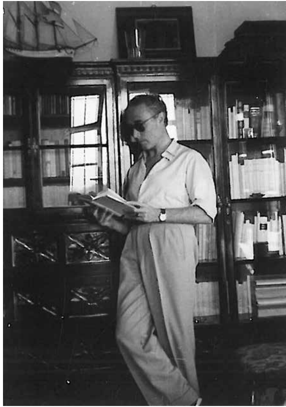
Juan Gil-Albert leyendo (1952)

Biblioteca Valenciana Nicolau Primitiu. Archivo Juan Gil-Albert.