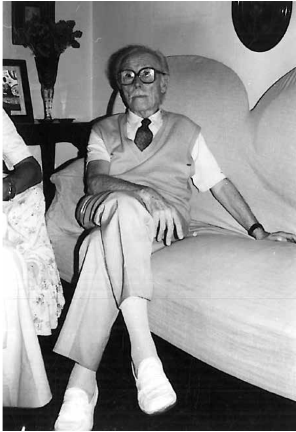
Juan Gil-Albert en el salón de su casa de la calle Taquígrafo Martí (1982)

Sólo queda la casa de la calle Colón, en Valencia, donde Juan Gil-Albert buscará el sosiego, acrecentará su obra, en el silencio de sus rincones, sin que vean la luz muchos de sus escritos, hasta mucho tiempo después.