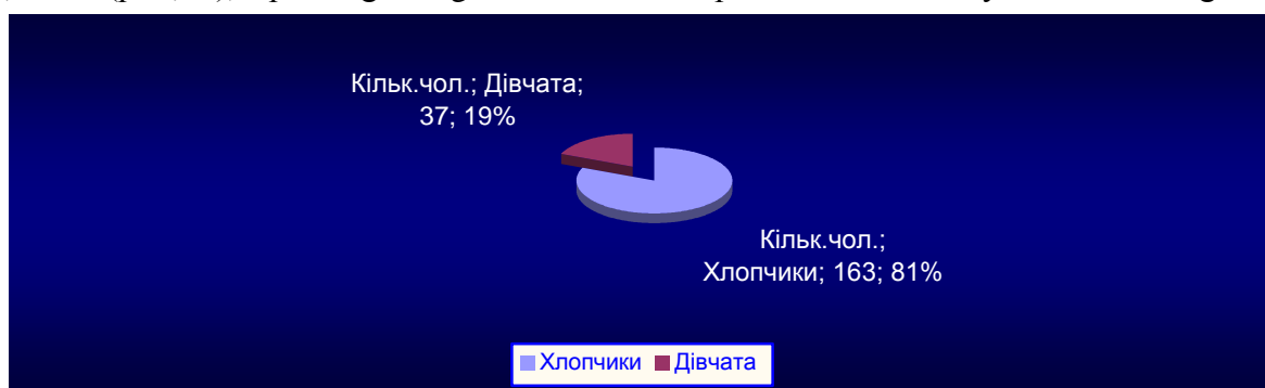
Рис. 1 - Показник захворюваності обстежених дітей з хворобами

При порівнянні середніх сезонних показників гуморального імунітету в обстежених весною дітей спостерігається: підвищення вмісту Ig G: 7,66 \pm 0,20 г/л, при N у здорових 6,80 \pm 0,40 г/л ( p < 0,01 ), а рівні Ig A і Ig M близькі до норми. Восени знижується тільки Ig M.