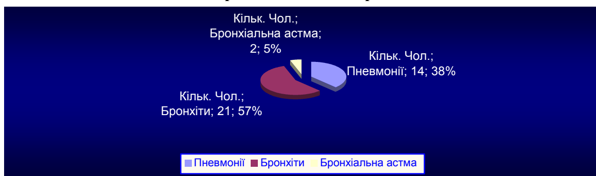
Рис. 3 - Показник захворюваності обстежених дівчат з хворобами органів дихання протягом 1999-2008 років.

Висновки. В умовах постійного зростання у повітрі шкідливих поллютантів, які впливають на імунітет дітей спостерігається то підвищення, то зниження сироваткових імуноглобулінів G, A, M у різні пори року. У весняний період – підвищується вміст Ig G, тому діти всіх вікових категорій найчастіше хворіють на бронхіти, і серед них – більше хлопців, ніж дівчат.