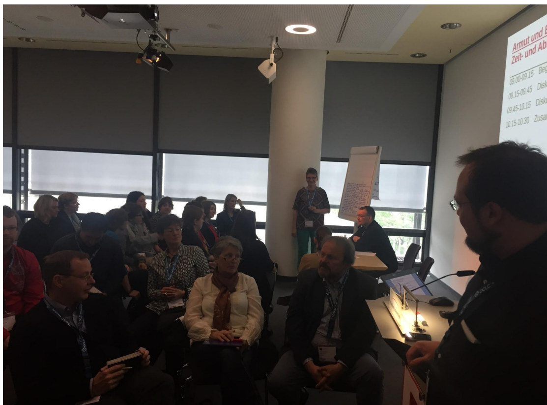
Abb. 1: Diskussionsrunde im World Café

Es wurde vermutet, dass von Armut betroffenen Menschen die Angebote von Bibliotheken nicht unbedingt bekannt sind und es sinnvoll sein könnte, genau daran anzusetzen, sie bekannt zu machen. Ebenso wurde vermutet, dass Bibliotheken für viele weiterhin als Einrichtungen gelten, die vor allem ein Angebot für den Mittelstand seien.