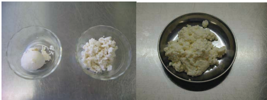
図4 牛乳・乳製品に関する実験の様子（2009年度・2010年度）

試料：脱脂粉乳 40g、牛乳 200ml、食酢 50ml、レモン汁 50ml、マヨネーズ