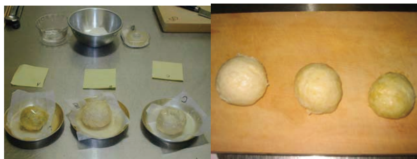
図2 小麦粉に関する実験の様子（2009年度）

試料：薄力粉 30 g × 3、ベーキングパウダー 1.2 g、重曹 0.3 g × 2、食酢 8g