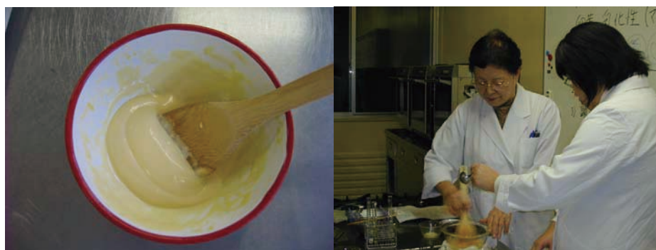
図3 卵に関する実験（2009年度・2010年度）

（マヨネーズの材料：卵黄 1個分、食酢 15ml、サラダ油 100ml、砂糖 小さじ 1/2、塩 1.5 g、洋がらし 小さじ 1/4、こしょう）