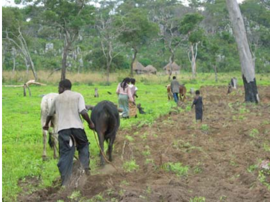
写真 6：拡大家族総出の耕起作業

耕作に切り替えた。それは、拡大家族内で起きている「過剰な死」の影響を、拡大家族内全体に波及させることを防ぐ効果は持っていたといえる。しかし、その後の経緯をみると、一部の「過剰な死」を抱える世帯はその後にも壮年者の死亡が続き、結局世帯としての農業生産が危ぶまれる状態になってきている。拡大家族単位の脆弱性緩和機能に依存できなくなった世帯の脆弱性は急速に悪化している。