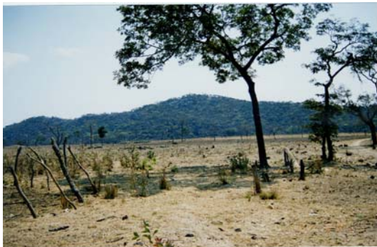
写真5:「開拓」された森林保護区

C村からも、もっと大きな耕地や換金作物生産に有利な低湿地(ダンボと呼ぶ)を求める農民たちが多くこの森に入っていった。1995年の2代目村長の死もこの動きに拍車をかけた。村長の死は土地の汚れや地力の衰えを示すとの理由で、あるいは新村長の自民族(レンジェ)中心主義を嫌って何人もの村人が森林保護区に移っていった。