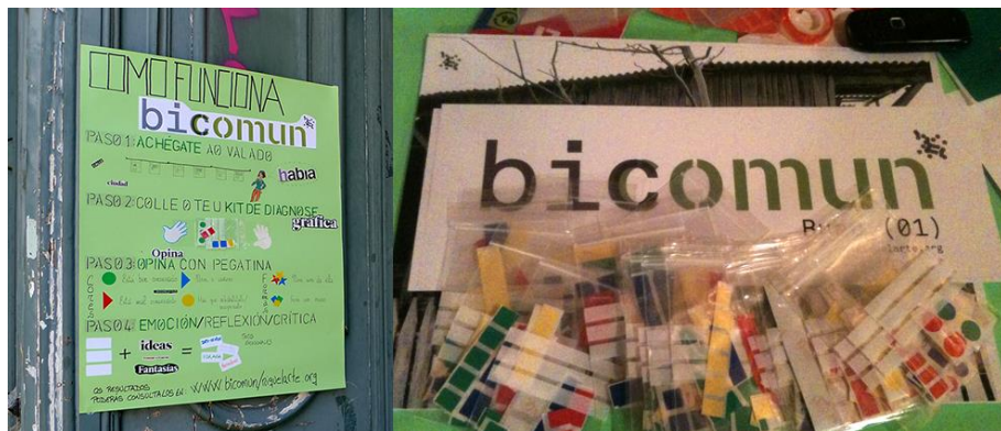
Fig. 3. Pegatinas y materiales que hacen posible el funcionamiento de BIComún

función de cada uno, está relacionada con el bien. Ejercicio interno, individual, en silencio, que sale del diálogo emocional. Lo que se escribe es una reflexión.