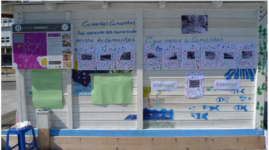
Fig. 4. Galería BIComún en la oficina de turismo de Camariñas