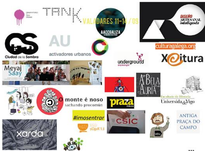
Fig. 7. Mosaico de la red que hemos ido tejiendo

colectivos que han ido aportando tiempo, ideas, cariño, ánimo, destrezas, habilidades pero sobre todo energía para hacer esto posible.