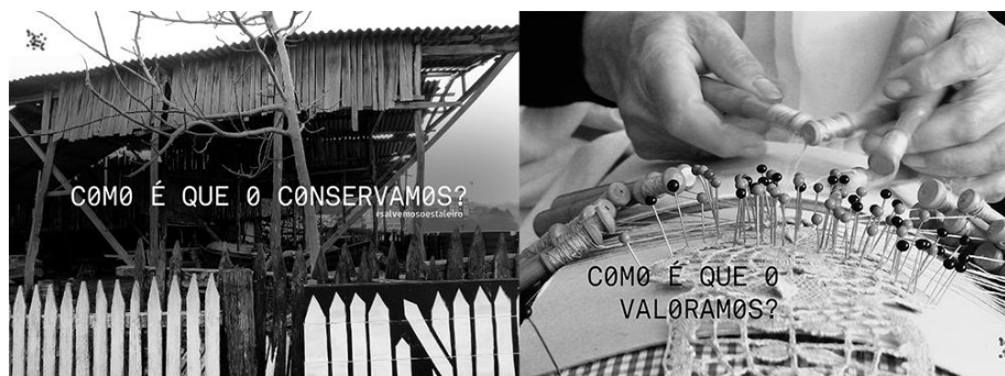
Fig. 2. Preguntas y elementos que convertimos en carteles

Pero, ¿cómo llevar esto a la práctica de una manera sencilla? Necesitábamos una metodología de trabajo para liberar este término e ir dándole vida. Intuíamos que era un concepto con definiciones múltiples y abiertas al que podíamos atribuirle la cita de Hakim Bey: