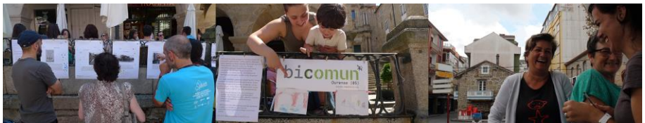
Fig. 6. Nada sería posible sin todo el mundo que se acerca, participa, sonríe y conversa

BIComún es un concepto en expansión, un proceso de experimentación y desarrollo que todavía está empezando y en la que han colaborado muchas personas y