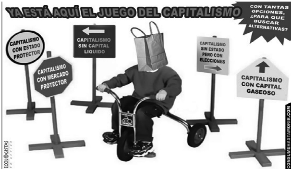
Imagen nº 2