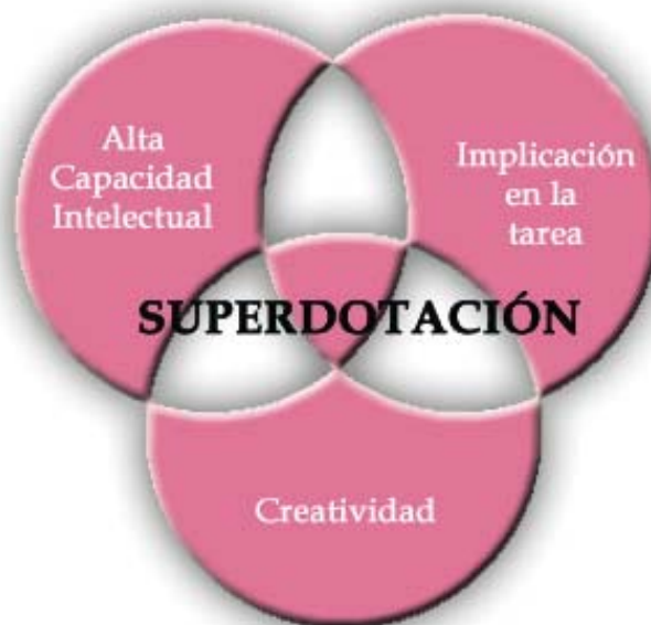
Figura 1: Modelo de Renzulli

Este modelo de superdotación fue posteriormente completado por Van Boxtel y Mönks (1992) añadiendo que si bien la presencia e interacción de estos rasgos básicos es fundamental para el desarrollo de un alto nivel productivo-creativo, no puede ser obviado y este modelo lo hace, la importancia de situar la superdotación en un contexto evolutivo y social en el que la influencia de los escenarios sociales familia, escuela e iguales, estarían igualmente contribuyendo al desarrollo de la competencia intelectual. EL modelo resultante es un modelo multifactorial que Mönks (1994) denominó “ Modelo de Interdependencia Triádica de la Superdotación ”.