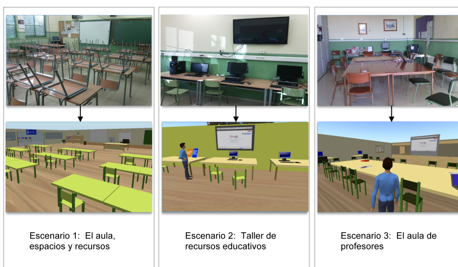
Figura 1: Escenarios educativos reales y en 3D

Fase 2: Evidencia. Se agruparon los indicadores en función del tipo de demanda que se exige en cada uno de ellos, tomando como referencia la versión revisada de la Taxonomía de Bloom (Anderson et al., 2001). Tras esta clasificación se distribuyeron, de manera equilibrada, en tres posibles escenarios que permitiesen generar situaciones donde evidenciarse tales resultados de aprendizaje: un aula, un espacio para la creación de recursos y un aula de profesores (Figura 1). Se trató de que los espacios fuesen similares a la realidad que se van a encontrar tales estudiantes en su contexto profesional (Dalgarno y Lee, 2010). Para ello se utilizaron referentes reales de centros de la misma comunidad autónoma, tanto para la organización espacial, como para la generación de objetos, documentos e instrucciones.