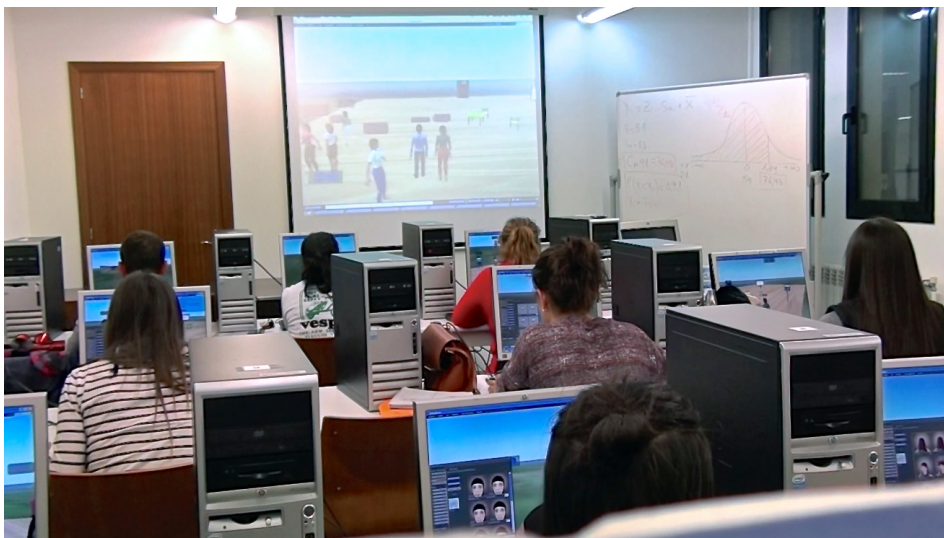
Figura 2. Grupo de estudiantes explorando el entorno 3D

Estos aspectos, relativos al control del usuario y a los gráficos fueron relacionados frecuentemente por los estudiantes con la sensación de inmersión. Según los resultados del cuestionario, el 67,8% de los estudiantes manifestaron olvidarse de la hora y de lo que ocurre a su alrededor al utilizar este entorno, frente a un 14,3% que se mostró en desacuerdo, siendo uno de los ítems mejor valorados. En la figura 2 podemos ver a una parte del grupo de estudiantes explorando el entorno. Alguno de los aspectos que destacaron positivamente relacionados con la sensación de inmersión fue la posibilidad de comunicarse con los compañeros y de trabajar en equipo. Según los resultados del cuestionario, el 67,9% de los estudiantes manifiesta que el entorno 3D le facilita hablar y comunicarse con sus compañeros de clase y el 71,4% afirma que este entorno les permite trabajar en equipo de manera adecuada.