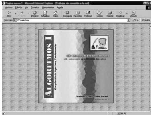
Figura III.1: Pantalla de presentación.