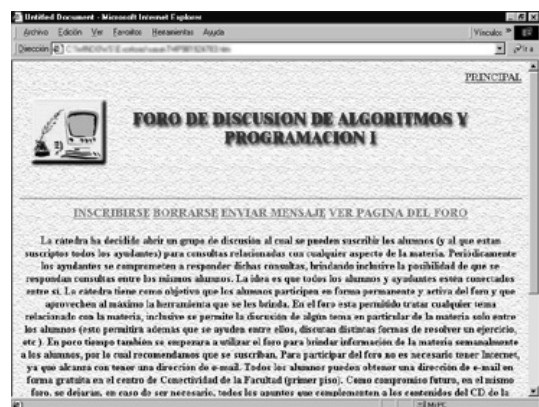
Figura III.6: Pantalla del foro de discusión.