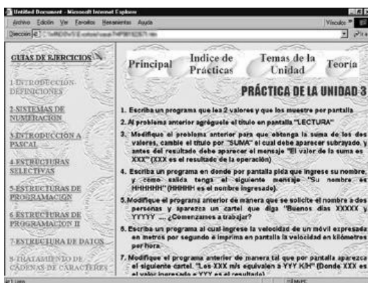
Figura III.5: Pantalla de Ejercicios y Problemas