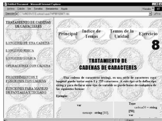
Figura III.4: Pantalla de unidad didáctica con hipervínculos.