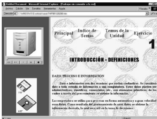
Figura IV.3: Pantalla de unidad didáctica, con videos