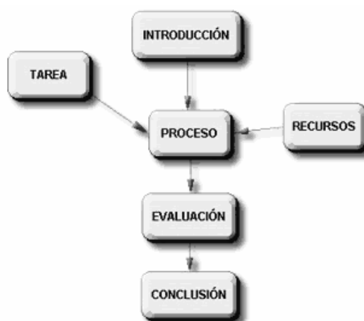
Figura 1. Partes esenciales de una WebQuest [tomado de http://www.eduteka.org/comenedit.php3?ComEdID=0010 ]

La finalidad de las introducciones es triple: por una parte, facilitar al alumnado una información inicial muy sintética del tema en torno a la cual va a girar la webquest; por otra parte, darle una orientación sobre lo que le espera en el desarrollo de la misma; y, por último, tratar de suscitar su interés y motivación, bien relacionándola con sus experiencias pasadas o metas futuras como profesionales de la educación (aprendizaje significativo), bien motivándole al ver que es importante por sus implicaciones, ya que pueden desempeñar un papel o realizar algo útil y provechoso para su futuro laboral. Por eso, todas las introducciones de las webquest se han diseñado siguiendo un proceso de simulación de incorporación a un futuro claustro de profesorado en un centro educativo. Cada una de las webquest supone una tarea necesaria para incorporarse a este claustro de profesores y profesoras. Terminar cada una de ellas implica dar un paso más, imprescindible y necesario, para incorporarse a la plantilla de este equipo docente. Se simula así un proceso de selección de profesorado a lo largo de toda la asignatura, siendo la conclusión el entrar a formar parte del centro educativo.