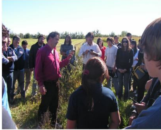
Foto 2. Productor comentando la experiencia de control de malezas con cultivos supresores