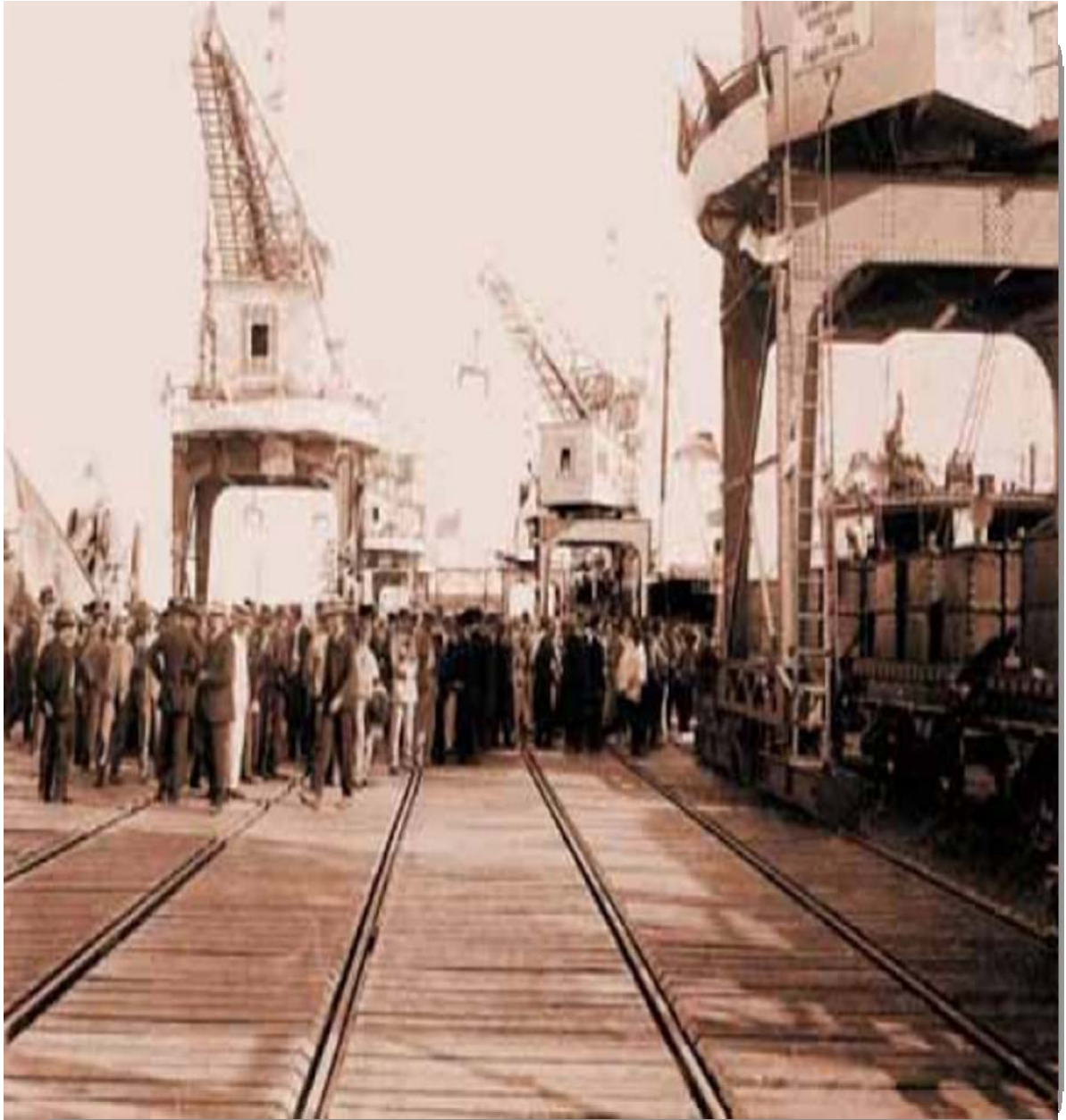
INAUGURACIÓN DEL MUELLE NORTE, 1908.