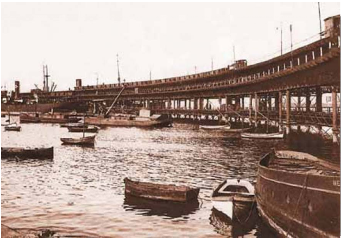
MUELLE DE LA COMPAÑÍA DE RIOTINTO, 1910.

De la primera etapa en la historia del Puerto de Huelva cabe destacar la cesión de la explotación a manos de un grupo de financieros británicos en 1873, en régimen semicolonial, de los recursos minerales de la sierra onubense, nace entonces “The Rio Tinto CompayLimited, que se convertiría en la empresa minera más importante del mundo, ocupando Tharsis el segundo lugar. Huelva estaba obligada a tener una buena comunicación con el exterior que facilitase la explotación y comercialización del mineral, por lo que estas grandes compañías construyeron muelles embarcaderos y toda una vía férrea que comunicaría el Puerto de Huelva con las minas, serán los primeros ferrocarriles que pertenecen a una compañía privada en toda España. El resto de las minas del Andévalo como Sotiel Coronada, Herrerías, Cala, etc., serán también explotadas por filiales de éstas. La llegada de este capital extranjero a Huelva, supuso una gran transformación en la misma ya que con ello se produjo un proceso industrializador, aunque no hay que olvidar que el papel de Huelva fue sobretodo el de enclave suministrador de materias primas. Este cambio supuso también un cambio en la fisonomía de la ciudad y del Puerto de Huelva que pasó de ser básicamente pesquero y sin ningún tipo de instalaciones a un puerto de gran capacidad exportadora.