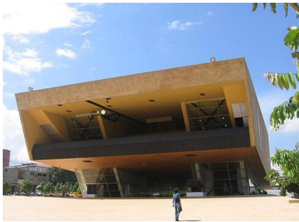
Casa de la Música