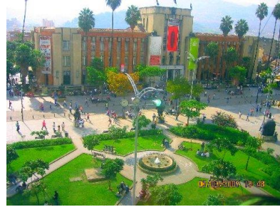
Museo de Antioquia