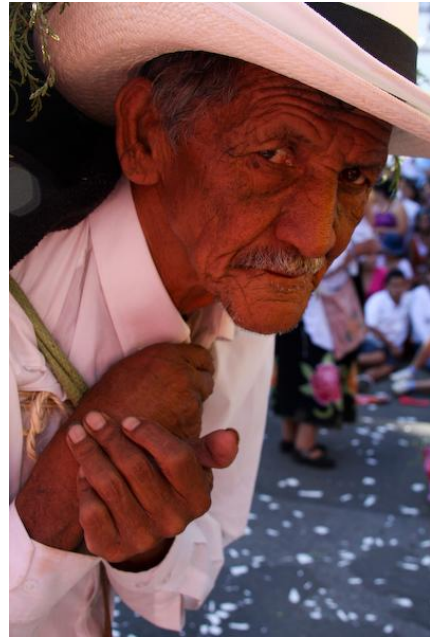
Silletero de Santa Elena