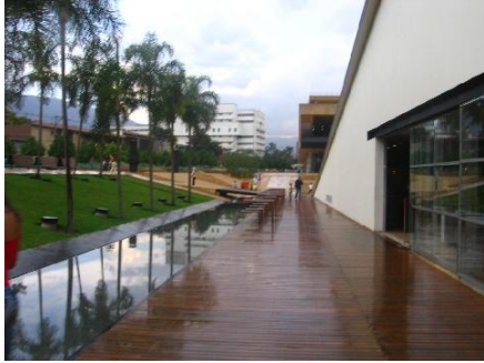
Parque de los Deseos