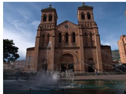
Catedral Basílica Metropolitana