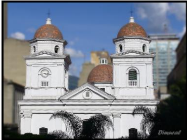
Iglesia de la Candelaria