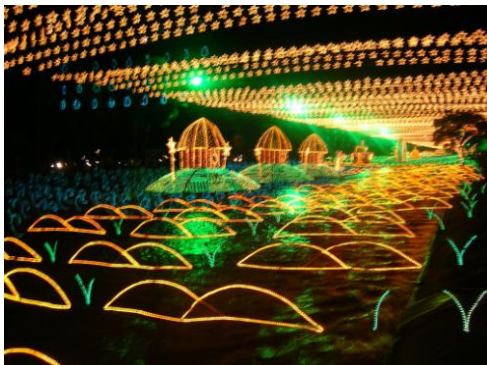
Alumbrados del Río de Medellín