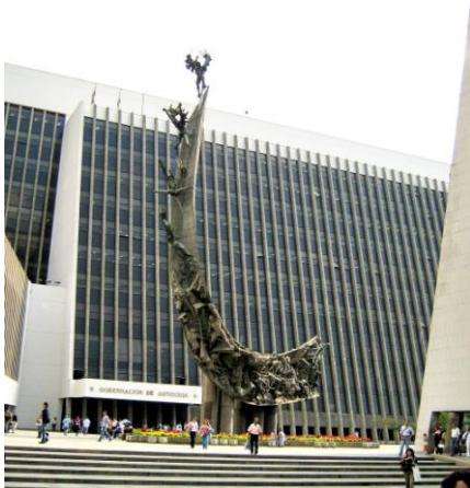
Centro Administrativo La Alpujarra