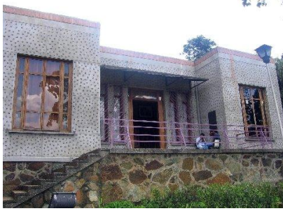
Casa Museo Pedro Nel Gómez