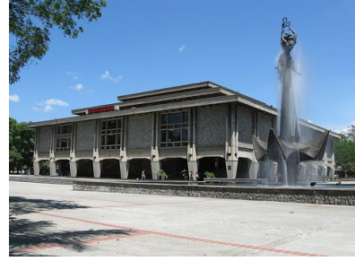
Universidad de Antioquia