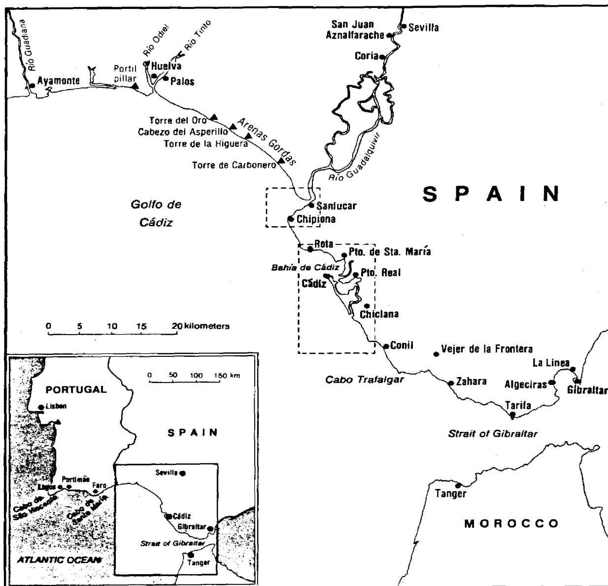
F.1. Mapa del Golfo de Cádiz. Reproducido del libro de Denise Lakey «Shipwrecks in the Gulf of Cadiz».