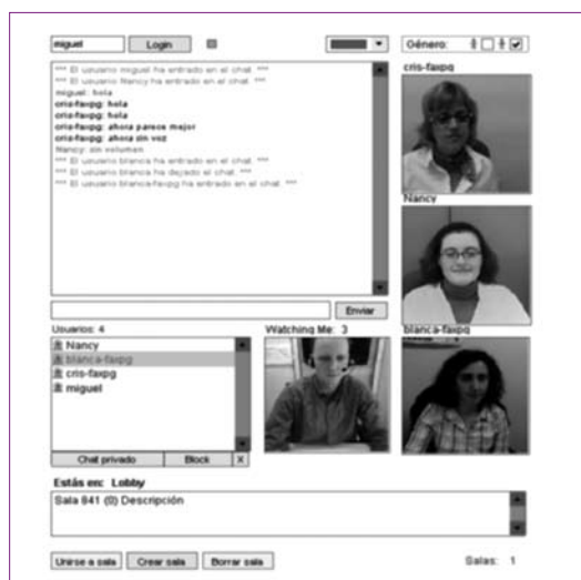
Fig.4. Ejemplo de seminario web donde predomina la comunicación

En el primer ejemplo se ha utilizado la videoconferencia y el chat para un curso de formación en Lengua de Signos Española. En esta sesión lo importante es la visualización de las personas para establecer la comunicación y una interacción fluida que permita a los alumnos ejercitar sus destrezas comunicativas. Se generan en el espacio compartido relaciones, comunicación y discusión.