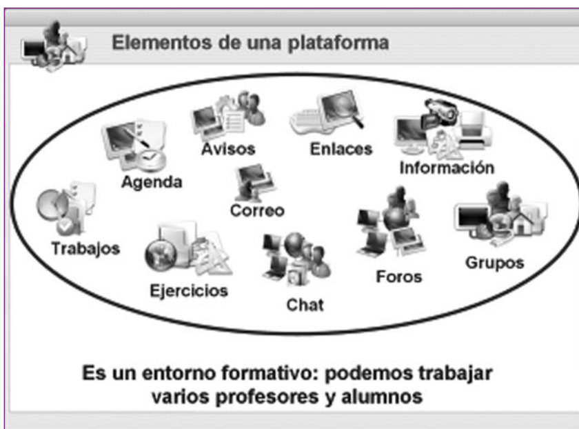
Figura 2. Elementos de una plataforma

Todas las plataformas introducen herramientas diferentes que se denominan de dos formas distintas, para que coincidan es sus funciones. La flexibilidad que permiten dejan a la persona que las utiliza la posibilidad de gestionarlas en función del ritmo de tareas y propuesta de actividades de tal manera que pueden aparecer a disposición de los miembros de la comunidad o no. Esto se hace ocultando la herramienta, pero en el momento que se necesite se puede poner operativa y todos los miembros de la comunidad la tendrían a su disposición. Por ejemplo, si el diseño didáctico implica el trabajo en grupo se dejaran operativas herramientas de comunicación y de generación de espacios para el trabajo en diferentes grupos. En la figura 2 aparecen las herramientas más comunes de una plataforma: