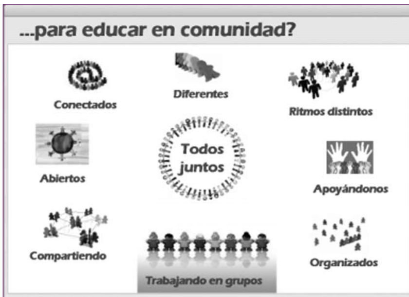
Fig. 1 Educar en comunidad.