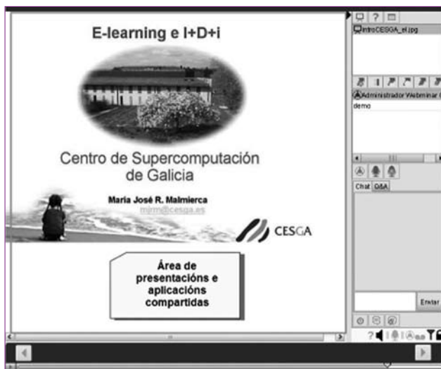
Fig. 3. Seminario web WebHuddle.

Estos recursos combinan varios medios y permiten el trabajo en tiempo real (o grabado) en streaming. Los medios que utilizan son: Audioconferencia, Videoconferencia, Escritorio compartido, Chat, Visualización de documentos, Intercambio de documentos, Pizarra compartida.