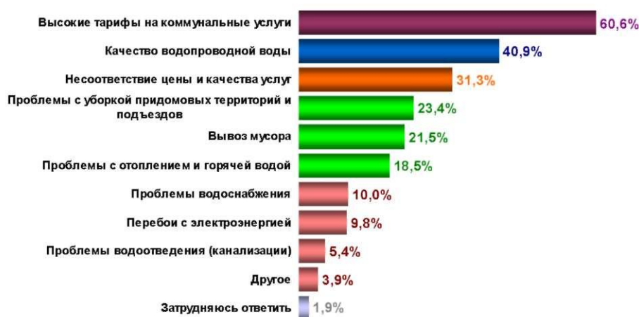
Рис. 1 – Результаты социологического опроса о проблемах ЖКХ.

Акцент, в данном определении, делается на важнейшее функциональное свойство товара: способность удовлетворять потребности потребителя. В реальности же, согласно данным ряда социологических опросов, проведенных Центром социальных технологий «Социополис» [12], которые озвучил Н.Я.Азаров: "...70% населения не удовлетворено качеством предоставляемых жилищно-коммунальных услуг". Это свидетельствует о том, что ЖКУ, как товар, не в полной мере удовлетворяют потребности населения. Ситуация более чем критическая: ЖКХ превратилось в отрасль производящую дефектные товары. Сложно представить подобное в иной сфере, где бы уровень брака составлял 70%, и при этом потребитель приобретал и оплачивал такой товар. Кроме того, снижающееся качество услуг сопровождается планомерным ростом тарифов, что еще более повышает уровень неудовлетворенности потребителей работой жилищно-коммунальных служб (рис. 1) [12].