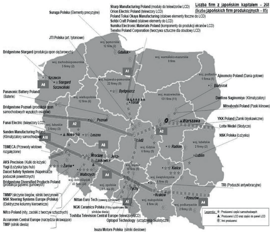
Rys 1. Główne japońskie firmy produkcyjne w Polsce

Opracowanie: Ambasada Japonii | Luty 2012