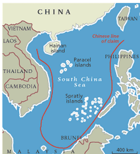
Mapa nr 1. Archipelagi Spratly i Paracel