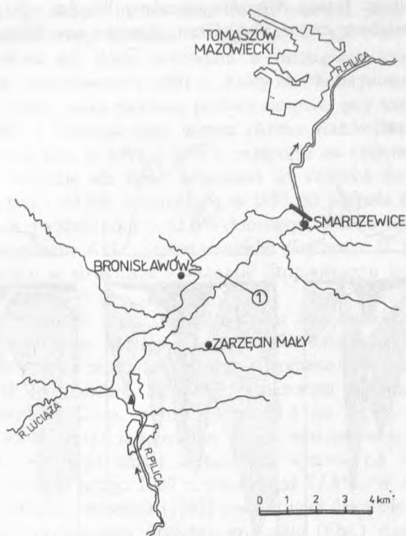
Rys. 1. Teren badań z zaznaczonym miejscem poboru prób Fig. 1. Study area with the marked sampling site