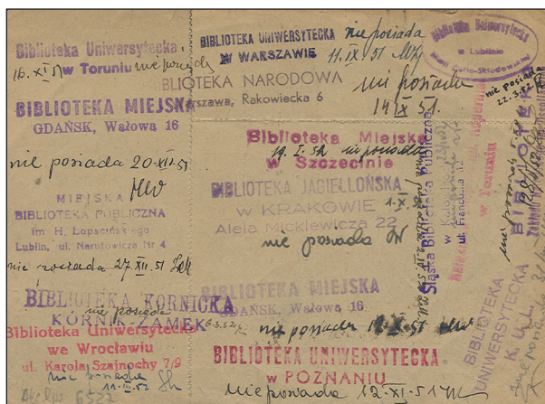
Ryc. 6. Rewers okrężny.

Studenci czwartego i piątego roku studiów oraz pracownicy naukowci Uniwersytetu Łódzkiego mieli do dyspozycji również Wypożyczalnię Międzybiblioteczną, która zajęła pokój na półpiętrze nowego gmachu. Agenda współpracowała z 78 bibliotekami krajowymi oraz 9 zagranicznymi (ryc. 6).