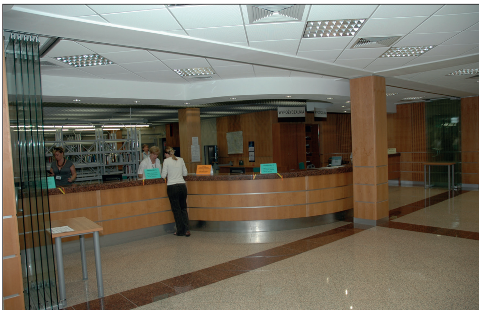
Ryc. 7. Wypożyczalnia obecnie.