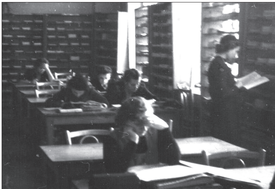
Ryc. 3. Czytelnia.

Jak wyglądało korzystanie przez czytelników z biblioteki oraz praca bibliotekarzy, najlepiej oddaje opis zamieszczony w łódzkiej gazecie: „Czytelnia mieszcząca się na I piętrze, ma tylko 48 miejsc, a powinno być 100. Czytelnicy i pracujący tu ludzie – przeważnie studenci, naukowcy, profesorowie – [...] nie mogą skupić uwagi na lekturze gdyż właśnie nad Czytelnią Główną mieści się sala ćwiczeń [...], gdzie odbywają się próby chórów, rytmiki i gimnastyki [...]. Książki dostarczane są w tzw. „kozłach” (ryc. 4). Pracownicy znoszą jak w swoim czasie kozłarze cegłę-książki do czytelni z III piętra, gdzie znajduje się magazyn główny, a po ich wykorzystaniu dźwigają je znowu na górę. Dodatkową trudność stanowi dostarczanie książek z magazynu znajdującego się przy al. Kościuszki 10 oraz ul. J. Matejki. Zamówione przez czytelników podręczniki znajdujące się w tych magazynach przewożone są do biblioteki przez gońców w teczkach lub plecakach” 2 .