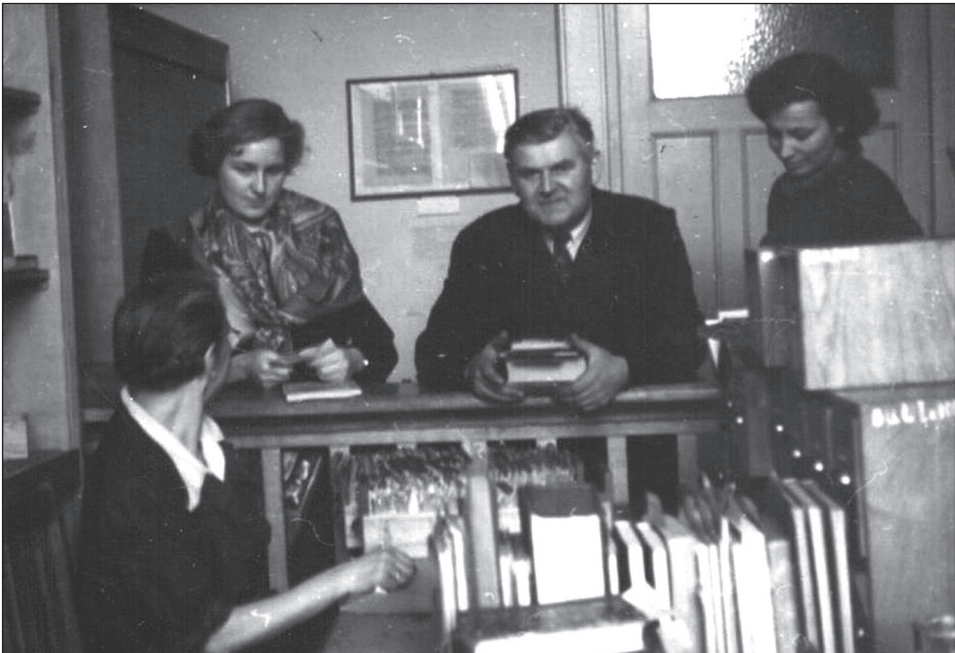
Ryc. 2. Wypożyczalnia.