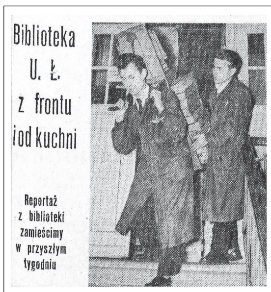
Ryc. 4. „Kozły” na plecach pracowników

Warunki korzystania ze zbiorów poprawiły się dopiero w 1961 r., po przeprowadzce do nowego gmachu przy ulicy Matejki 32/34. Czytelnia Główna i Czytelnia Czasopism Bieżących z wolnym dostępem do półek, liczące po 160 miejsc, oraz tzw. czytelnia profesorska otrzymały pomieszczenia na II piętrze. W sprawozdaniu za rok 1960 odnotowano ponad 39 tys. odwiedzin. Użytkownicy korzystali zarówno z księgozbioru podręcznego, (którego aktualizacja odbywała się w oparciu o ankiety przeprowadzane wśród pracowników naukowych uczelni), (ryc. 5) jak i z materiałów znajdujących się w magazynie.