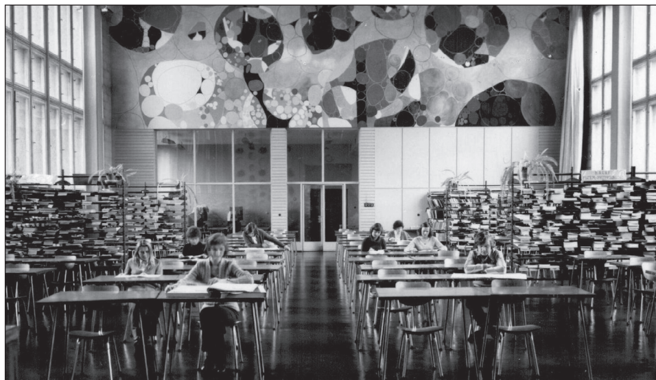
Ryc. 3. Czytelnia Czasopism BUŁ.