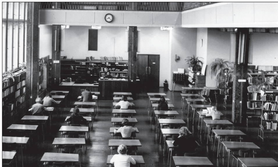
Ryc. 2. Czytelnia Główna BUŁ.

w ciągu dwóch pierwszych dekad funkcjonowania wyróżniała się na tle innych bibliotek uniwersyteckich w kraju. Odnotowywano tu jedne z największych wskaźników udostępnianych i wypożyczanych dzieł. Świadczy to o randze młodej instytucji oraz właściwym jej rozwoju.