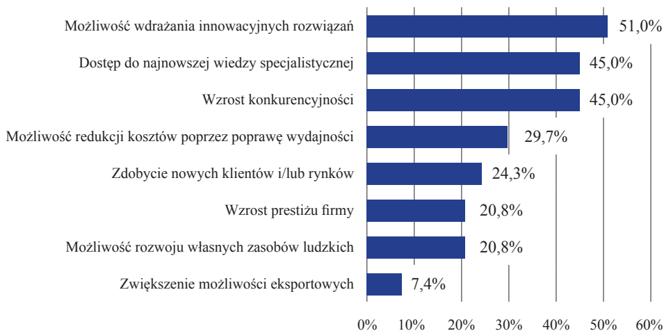
Rys. 1. Korzyści wynikające ze współpracy przedsiębiorstw z jednostkami sfery nauki (w %)

wydajności (29,7% wskazań). Natomiast mało istotne okazały się dla badanych przedsiębiorstw korzyści odnoszące się do zwiększenia możliwości eksportowych (7,4% wskazań – por. rys. 1.).