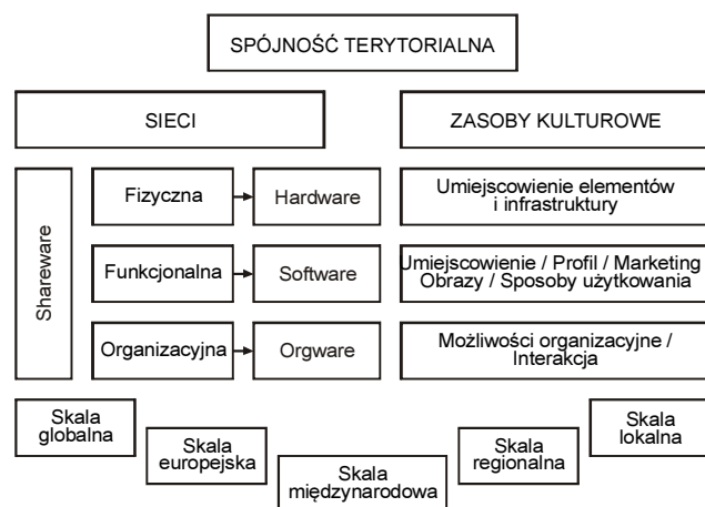
Rys. 1. Spójność terytorialna: model analityczny

- możliwości i ograniczenia obecnego orgware – typy i wpływ organizacji, udział różnych partnerów, włączenie i wyłączenie Community Stakes udziału społeczeństwa.