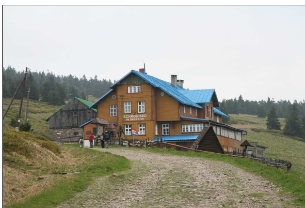
Fot. 2. Masyw Śnieżnika – schronisko „Na Śnieżniku”