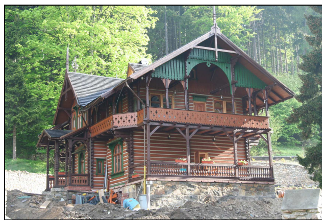
Fot. 10. Międzygórze – przykład zabudowy turystycznej z XIX w.