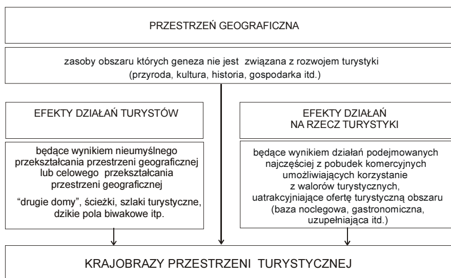
Rys. 1. Elementy wpływające na krajobrazy przestrzeni turystycznej

- celowe przekształcanie przestrzeni geograficznej – wszelkie działania indywidualne lub grupowe mające na celu przystosowanie (zaadaptowanie) przestrzeni geograficznej do własnych potrzeb wypoczynku i rekreacji (m.in. stałe elementy zagospodarowania turystycznego, osadnictwo turystyczne – drugie domy). Działania te pozostawiają trwałe i widoczne ślady w przestrzeni i mogą decydować o cha-