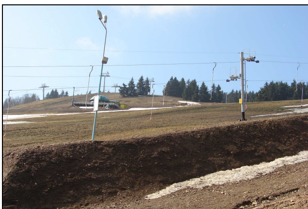
Fot. 8. Przykład dewastacji krajobrazu poprzez zbyt intensywne wykorzystanie przez turystykę narciarską – Zieleniec w Górach Orlickich, widoczna erozja stoków (na pierwszym planie fragment rynny snowboardowej)

Typ V , wyróżniający się umiarkowanym zainwestowaniem oraz takim wykorzystaniem turystycznym, które nie wpływa degradująco na środowisko przyrodnicze. Infrastruktura turystyczna takiej przestrzeni nawiązuje zazwyczaj do lokalnych (historycznych) form zabudowy lub wykorzystuje elementy zainwestowania wcześniejszego. Ruch turystyczny obserwowany w tego typu krajobrazie nie jest inwazyjny i ogranicza się głównie do penetracji obszaru z wykorzystaniem istniejącej sieci szlaków turystycznych. Ten typ krajobrazu można nazwać turystycznym krajobrazem zrównoważonym lub harmonijnym 5 .