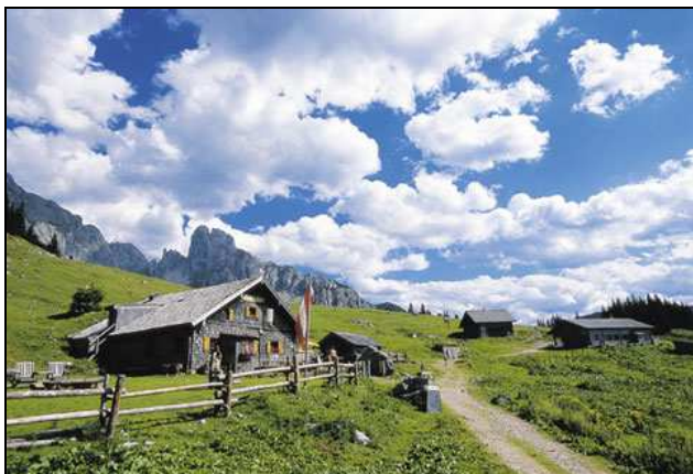
Fot. 1. Alpy austriackie – schronisko na szlaku turystycznym