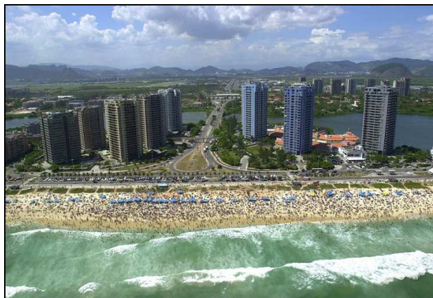
Fot. 4. Krajobraz przestrzeni turystycznej Rio de Janeiro – widok na dzielnicę Barra da Tijuca i plażę o tej samej nazwie (źródło: materiały promocyjne)