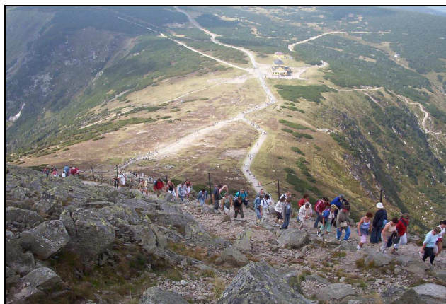
Fot. 5. Karkonoski Park Narodowy – widok ze Śnieżki w kierunku schroniska „Dom Śląski”, na dalszych planach wyraźnie widoczne liczne szlaki intensywnie eksploatowane w sezonach turystycznych