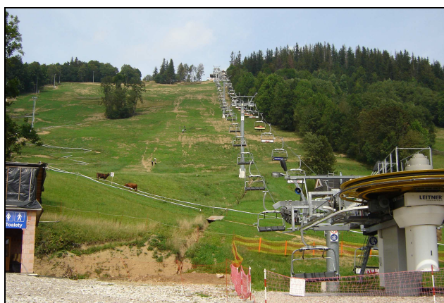
Fot. 6. Negatywne skutki intensywnej eksploatacji stoków narciarskich – ośrodek narciarsko-rekreacyjny „Harenda” w Zakopanem (autor: J. Ustupski 2007)

uznanych za najbardziej atrakcyjne turystycznie. Są to także zazwyczaj obszary monokultury turystycznej (dominacja jednej lub kilku pokrewnych form ruchu turystycznego), głównie o charakterze wypo-