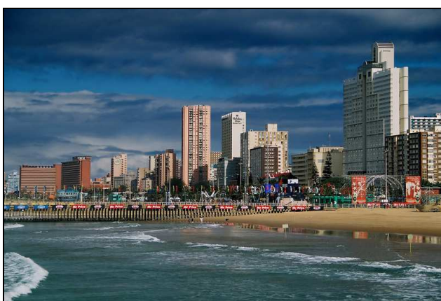
Fot. 3. Krajobraz przestrzeni turystycznej Durbanu (RPA)