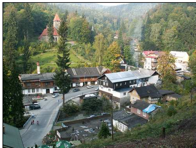
Fot. 9. Międzygórze – przykład harmonii w przestrzeni i krajobrazie

Jako przykład można podać krajobraz turystyczny stacji klimatycznej Międzygórze w Masywie Śnieżnika, w której z wyjątkiem jednego z obiektów