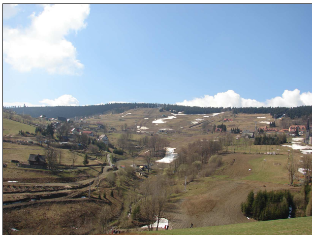
Fot. 7. Przykład dewastacji krajobrazu poprzez zbyt intensywne wykorzystanie przez turystykę narciarską – Zieleniec w Górach Orlickich, na pierwszym planie widoczne efekty przystosowania stoków pod nartostrady

Typ IV stanowią te przestrzenie, które charakteryzuje małe zainwestowanie, ale stosunkowo duże wykorzystanie turystyczne. Przykładem mogą być obszary parków narodowych (szczególnie tych najbardziej atrakcyjnych), gdzie pomimo ograniczeń w budowie infrastruktury turystycznej w krajobrazie wyraźnie można odczytać negatywne efekty nadmiernej eksploatacji tych przestrzeni. Podobnym typem krajobrazu cechują się także obszary stacji narciarskich, w których zainwestowanie ogranicza się jedynie do wyciągów i tras zjazdowych oraz nielicznych obiektów noclegowych i gastronomicznych, ale efekty intensywnej aktywności turystycznej w sezonie (widoczne głównie poza sezonem narciarskim) są zdecydowanie negatywne, szczególnie dla przyrodniczych komponentów krajobrazu (fot. 5–8).