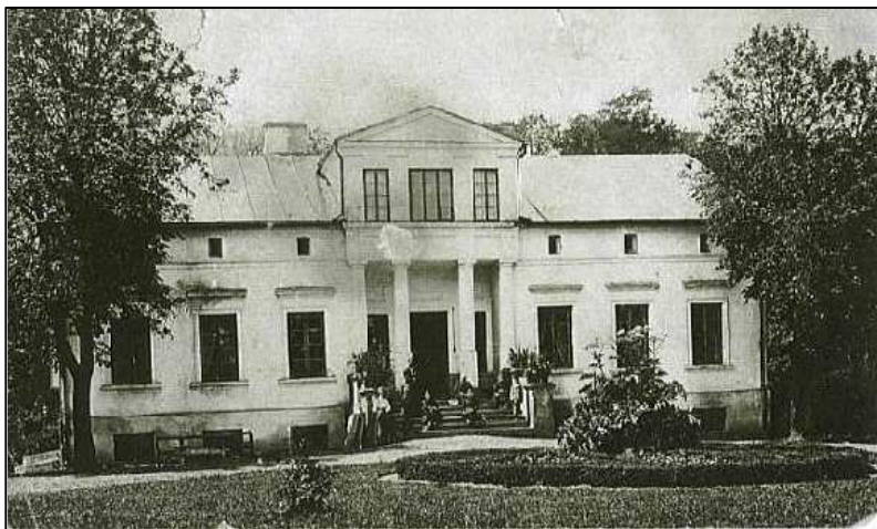
Rys. 2. Dwór w 1911 r.