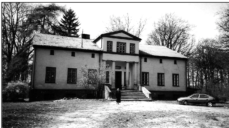
Rys. 3. Dwór w 2002 r.