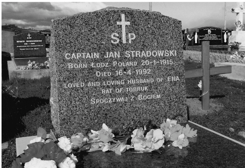
Fot. 1. Płyta nagrobna kapitana Jana Stradowskiego (z napisem RAT OF TOBRUK – „szczur Tobruku”) pochowanego w Hobart w Australii

Brygady obejmowali placówki obronne i gniazda bojowe pod Tobrukiem.