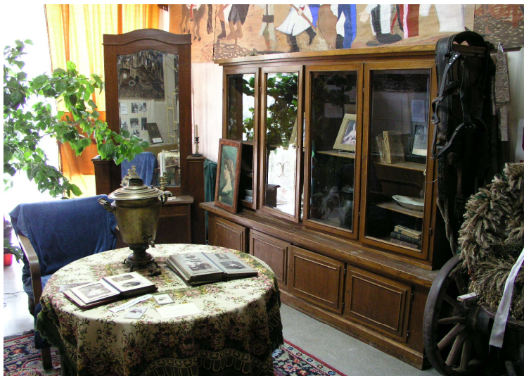
Fot. 3. Muzeum szkolne w Szadku – fragment ekspozycji w saloniku Tadeusza Kościuszki.

oraz wystaw historycznych, organizowanych z okazji świąt państwowych i jubileuszy szkoły; odbywają się tu również liczne lekcje muzealne.