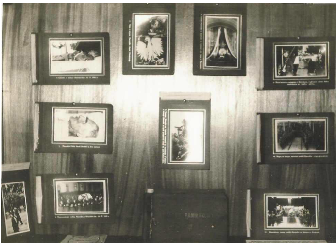
Fot. 7. Fragment ekspozycji prezentującej zdjęcia z uroczystości pogrzebowych J. Piłsudskiego

Okres walk o niepodległość Polski ilustrują pamiątki i odznaczenia wojskowe: Krzyż Walecznych, którym odznaczony został Franciszek Królak za walki na wschodzie w 1920 r., książeczka wojskowa Kazimierza Lenca, który walczył z wojskami radzieckimi i ukraińskimi w latach 1919–1920, legitymacja Odznaki Pamiątkowej 3 Batalionu Strzelców nr 1863 z 12 kwietnia 1933 r. Muzeum posiada również pamiątkę związaną z Marszałkiem Polski, Józefem Piłsudskim jest nią album pamiątkowy z uroczystości pogrzebowych J. Piłsudskiego z 1935 r. (fot. 7) 13 .