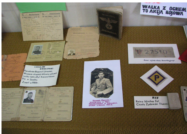
Fot. 11. Dokumenty z lat okupacji

W zbiorach muzeum szadkowskiego znajduje się również szereg innych dokumentów z lat wojny (fot. 11), wiele z nich ilustruje obowiązek przymusowej pracy na rzecz III Rzeszy ( Arbeitsbuch, Arbeitkart ).