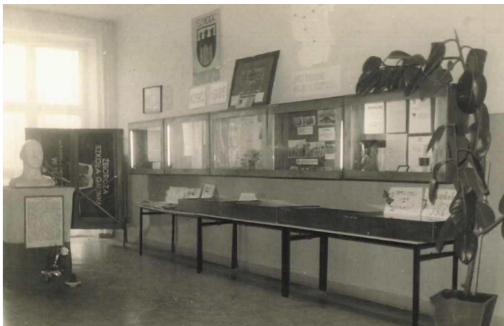
Fot. 1. Muzeum szkolne w Szadku – fragment wystawy Mój region moja ojczyzna z 1988 r. z popiersiem gen. Karola Świerczewskiego

Zbiory, które zgromadziła młodzież w latach siedemdziesiątych w ogromnej większości zachowały się do dziś, natomiast kolekcja muzeum w kolejnych dziesięcioleciach uległa istotnemu wzbogaceniu dzięki pasji historycznej młodzieży szkolnej pozostającej pod opieką autorki tego opracowania.