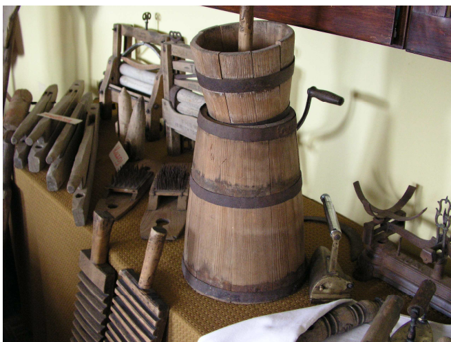
Fot. 5. Muzeum szkolne w Szadku – fragment ekspozycji poświęconej chłopskiej zagrodzie

Sprzęt domowy reprezentują: łopata do wyjmowania chleba, koszyczki i formy słomiane, w których dojrzewało ciasto chlebowe, kwećki drewniane do przegniatania ziemniaków i praska do sera (fot. 5).