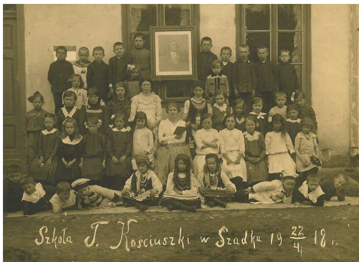
Fot. 2. Zdjęcie Szkoły Podstawowej w Szadku im. Tadeusza Kościuszki z 1918 r.