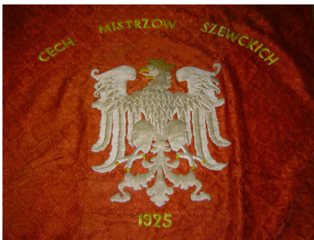
Fot. 6. Sztandar cechu szewskiego w Szadku