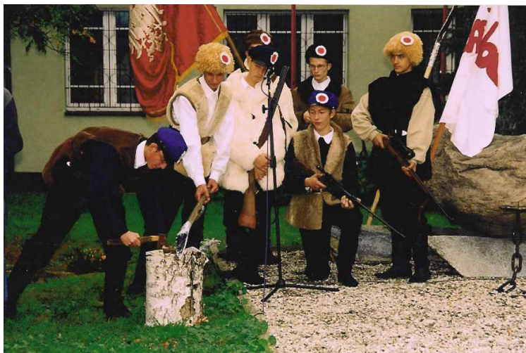
Fot. 4. Prezentacja zbiorów muzeum szkolnego w Szadku – scenka historyczna o powstaniu styczniowym (październik 2003 r.)

Zestawienie działalności wystawienniczej i pokrewnej muzeum szkolnego w Szadku w okresie ostatnich 20 lat przedstawia się następująco: