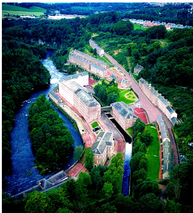
Rys. 2. New Lanark – widok z lotu ptaka

Mimo braku symetrii, wynikającego głównie z dolinnej rzeźby terenu, rozplanowanie budynków było niezwykle przemyślane. Szerokie ulice i znaczne odległości między budynkami pozwalały, by światło słoneczne docierało do najniższych pięter, nawet w miesiącach zimowych. Całość założenia idealnie wpisała się w topografię terenu. Fizjonomię kompleksu w większości zdominował tradycyjny styl szkockiego budownictwa czynszowego. Głównym materiałem budowlanym był kamień, piaskowiec bądź granit. Przedsiębiorstwo New Lanark funkcjonowało do 1968 r. Z upływem lat wiele elementów infrastruktury uległo zniszczeniu i wymagało licznych prac konserwatorskich i rewaloryzacyjnych. Budynki starannie odrestaurowano i przywrócono im stan z czasów świetności. W 2001 r. New Lanark zostało wpisane na listę światowego dziedzictwa UNESCO. Obecnie stanowi unikalny zespół, będący kompilacją XVIII-wiecznego osadnictwa przemysłowego i urozmaiconego dolinnego krajobrazu rzeki Clyde, zasobnego w spektakularne wodospady, kamienne turnie oraz ciekawe formy terenu (rys. 2).