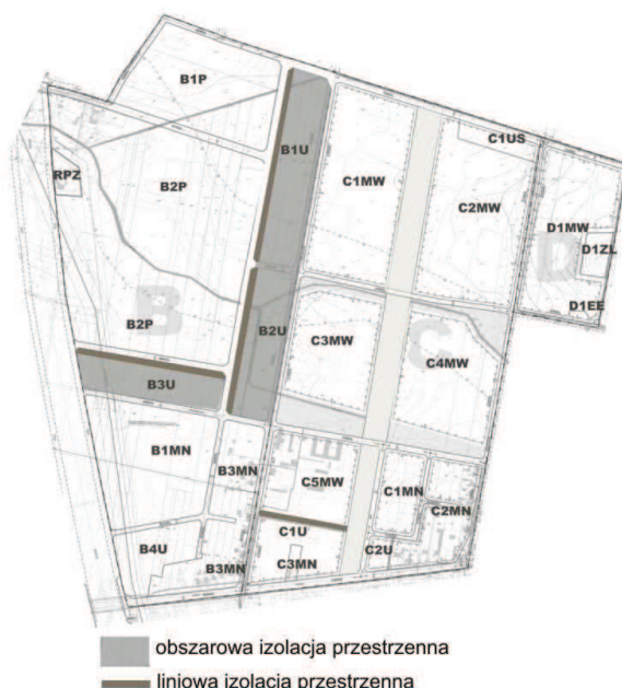
Rys. 5. Rozwiązywanie konfliktów przestrzennych pomiędzy terenami o kolizyjnym przeznaczeniu – wprowadzanie stref buforowych obszarowych w postaci usług oraz stref liniowych w postaci zieleni wysokiej zimozielonej na przykładzie fragmentu Miasta Konstancyna Łódzkiego