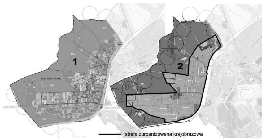
Rys. 3. Buforowanie przestrzeni leśnej i zurbanizowanej

Zapobiega to lokalizowaniu zabudowy w przypadkowych miejscach na działkach budowlanych bez odpowiedniej obsługi infrastrukturalnej i odpowiedniej kolejności ingerowania w krajobraz otwarty. Umożliwia to przekształcenie terenu rolnego w teren budowlany z zachowaniem podstaw cywilizacyjnego bytu oraz wprowadzeniem ładu przestrzennego w nowo kreowaną przestrzeń (rys. 3).