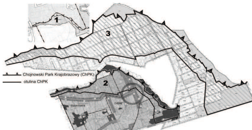
Rys. 1. Negatywny przykład rozparcelowania na działki budowlane przestrzeni cennej przyrodniczo

Krajobrazowego w jednej z gmin podwarszawskich (rys. 1). Opracowany plan ochrony dla tego parku 1 nonszalancko przeznaczył cały, kilkudziesięci-hektarowy obszar wzdłuż dużego kompleksu lasów państwowych pod realizację zabudowy mieszkaniowej ekstensywnej. Studium przełożyło zapisy planu ochrony parku w sposób dosłowny i umożliwiło przekształcenie terenu rolnego w teren budowlany z podziałem na działki rezydencjonalne o powierzchniach nie mniejszych niż 2 500 m 2 . Opierając się o zapisy Studium wykonano plany miejscowe obejmujące obszar planowanej zabudowy ekstensywnej, co w efekcie umożliwiło całkowite rozparcelowanie wielkich przestrzeni otwartych objętych formami ochrony. Co gorsza plany nie zakładały obowiązku wyposażenia obszaru w niezbędną, gminną infrastrukturę techniczną przed realizacją zabudowy, co w efekcie doprowadziło do lokalizacji zabudowy w sposób jednostkowy i przypadkowy.