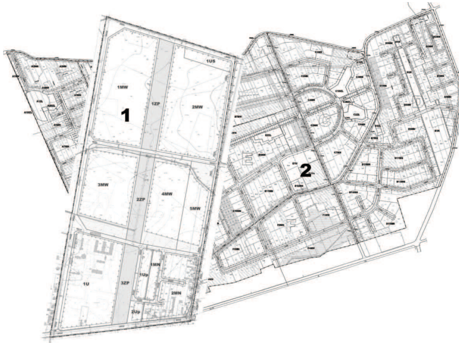
Rys. 4. Różne sposoby kształtowania zabudowy mieszkaniowej jednorodzinnej i wielorodzinnej