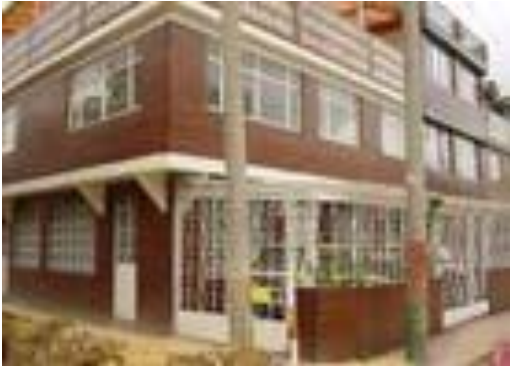
Figura 3. Fundación Niños de Los Andes Sede Caza corazones, Bogotá.