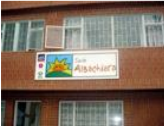
Figura 4. Fundación Niños de Los Andes Sede Albachiera, Bogotá.