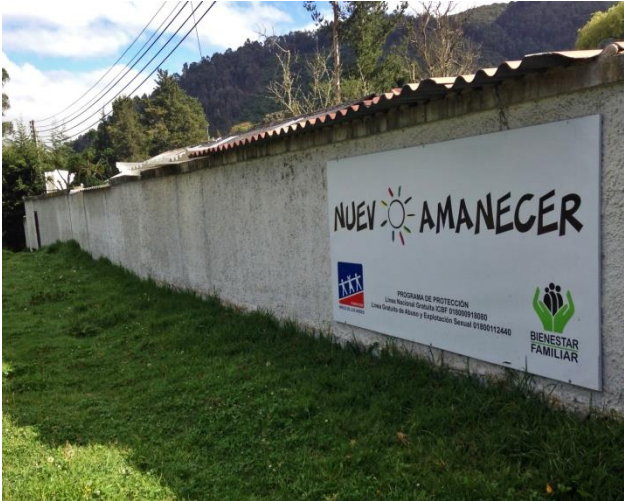
Figura 2. Fundación Niños de Los Andes Sede Nuevo Amanecer