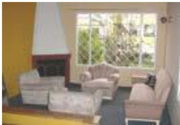
Figura 1. Fundación Niños de Los Andes Sede St. Patrick, Bogotá.

Los servicios que se ofrecen en todos los programas mencionados son la atención médica, acogida y adaptación, cuidado sustituto, seguimiento pedagógico, espacios recreativos, intervención con familias, atención a chicos con consumo de sustancias psicoactivas y seguimiento (Jaramillo, 2014).