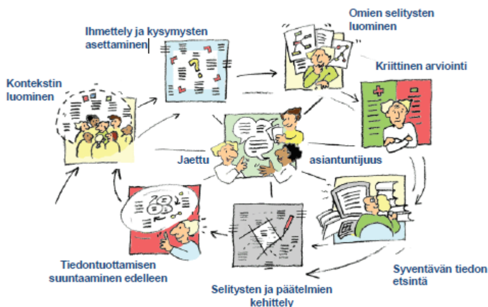
Kuvio 1. Tutkivan oppimisen osa-alueet (Hakkarainen ym. 2005, 30; Lakkala, M. 2012, 93). (Hakkaraisen ym. kuvio Lakkalan soveltamana)

liittyviä kuvauksia ja kysymyksiä. Näiden lisäksi uutta tietoa ja ymmärrystä tutkimusaiheesta tuotetaan ja arvioidaan. (Paavola, Hakkarainen & Seitamaa-Hakkarainen 2006, 148.)