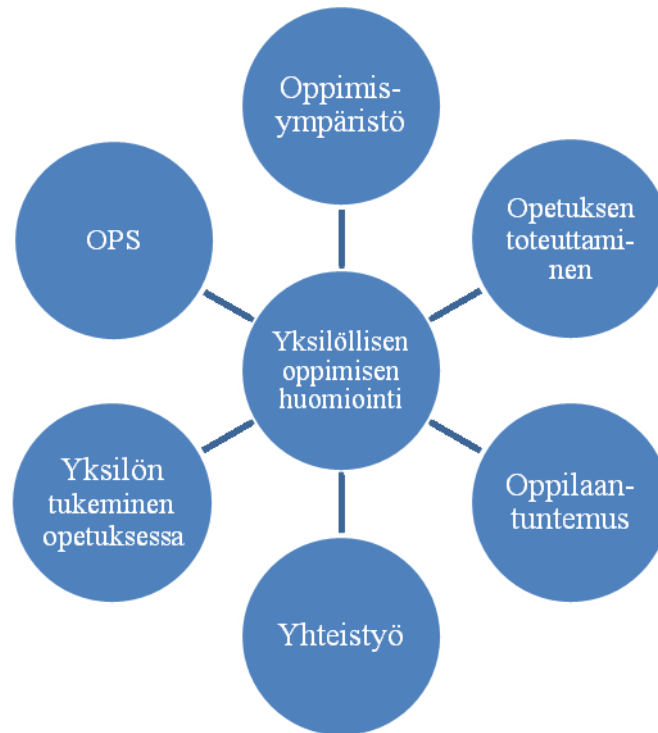
KUVIO 3. Yksilöllisen oppimisen huomiointi