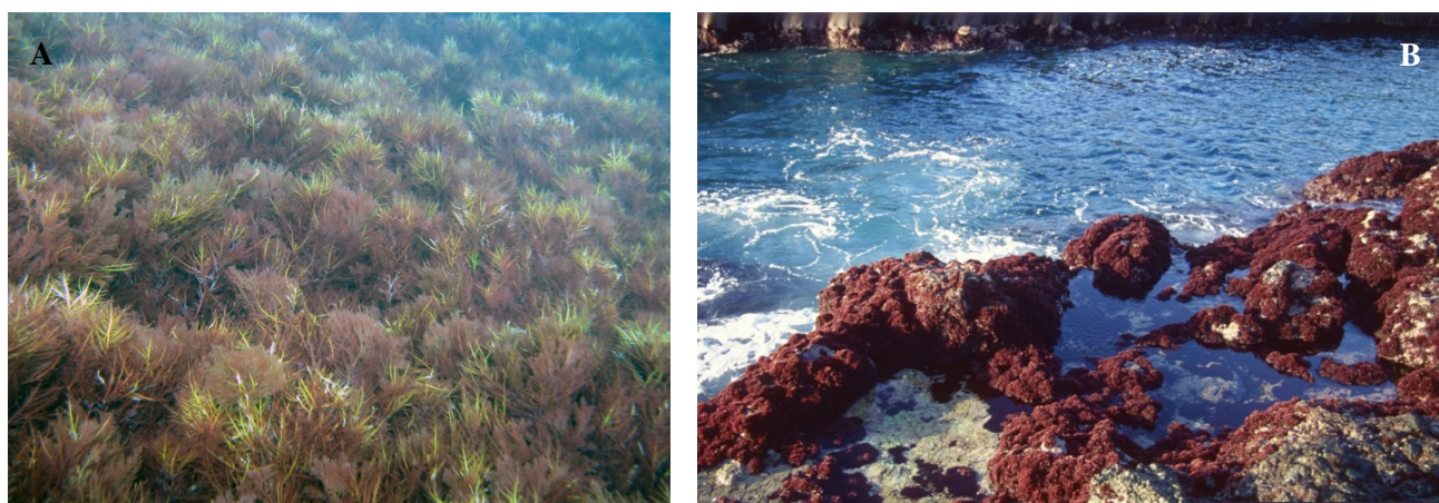
Figura 3. A) Gelidium corneum en la zona submareal del Cantábrico; B) G. arbusculum intermareal en las Islas Canarias.

polyschides , que aparecían de forma parcheada en este área (Díez et al. 2012). Observaciones recientes en varias localidades muestran una cobertura mínima de algas tras la completa desaparición de las praderas que esta especie formaba. Las poblaciones de otras dos especies del género Gelidium , G. canariense y G. arbusculum (Fig. 3B), endémicas de las Islas Canarias y de las costas africanas próximas, han disminuido también de forma drástica recientemente (Sansón et al. 2013), incluidas localidades donde fueron explotadas con fines industriales en el pasado (Alfonso-Carrillo 2003). Estas observaciones sugieren tendencias similares de declive de las macroalgas en zonas distantes del litoral Atlántico.