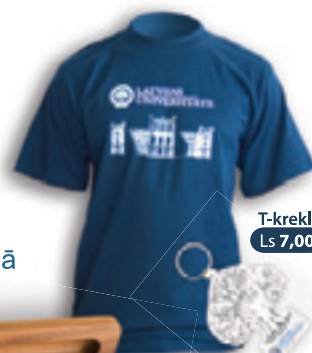
T-krekls Ls 7,00