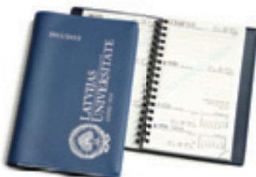
Plānotājs Ls 2,00