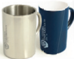
Krūze Ls 5,50