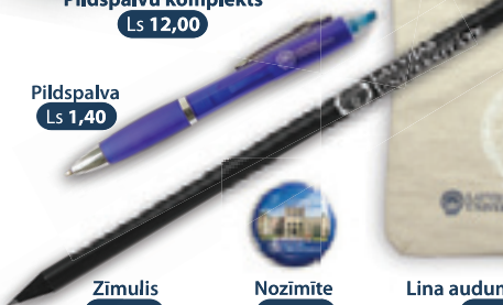
Pildspalva Ls 1,40