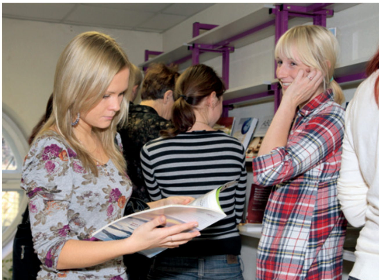
Saņemtais dāvinājums ļaus paplašināt studentu studiju un zinātniskās pētniecības iespējas

http://www.lu.lv/biblioteka/par-biblioteku/struktura/medicinas/