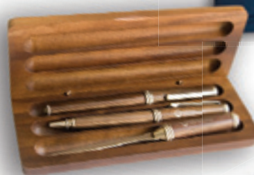
Pildspalva komplekts Ls 12,00