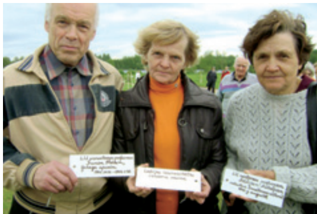
LU senioru viesošanās Lielvārdzē.

Ziemā reizi mēnesī notiek senioru diskusiju kluba tikšanās, kuru laikā vai nu kāds no biedriem, vai arī zinātnis no malas piedāvā padziļinātu informāciju par kādu tēmu. Pēc ziņojuma noklausīšanās visi klātesošie turpina diskusijas un pauzē arī savu viedokli. Tēmas līdz šim ir bijušas visdažādākās – par pensiju sistēmu, dažādu ievērojamu cilvēku dzīvi, Baltijas jūras krastu eroziju, bebru un lāču populācijām Latvijā, veselības aprūpes un pedagoģijas jautājumiem, Latvijas sēnēm un ļoti daudziem