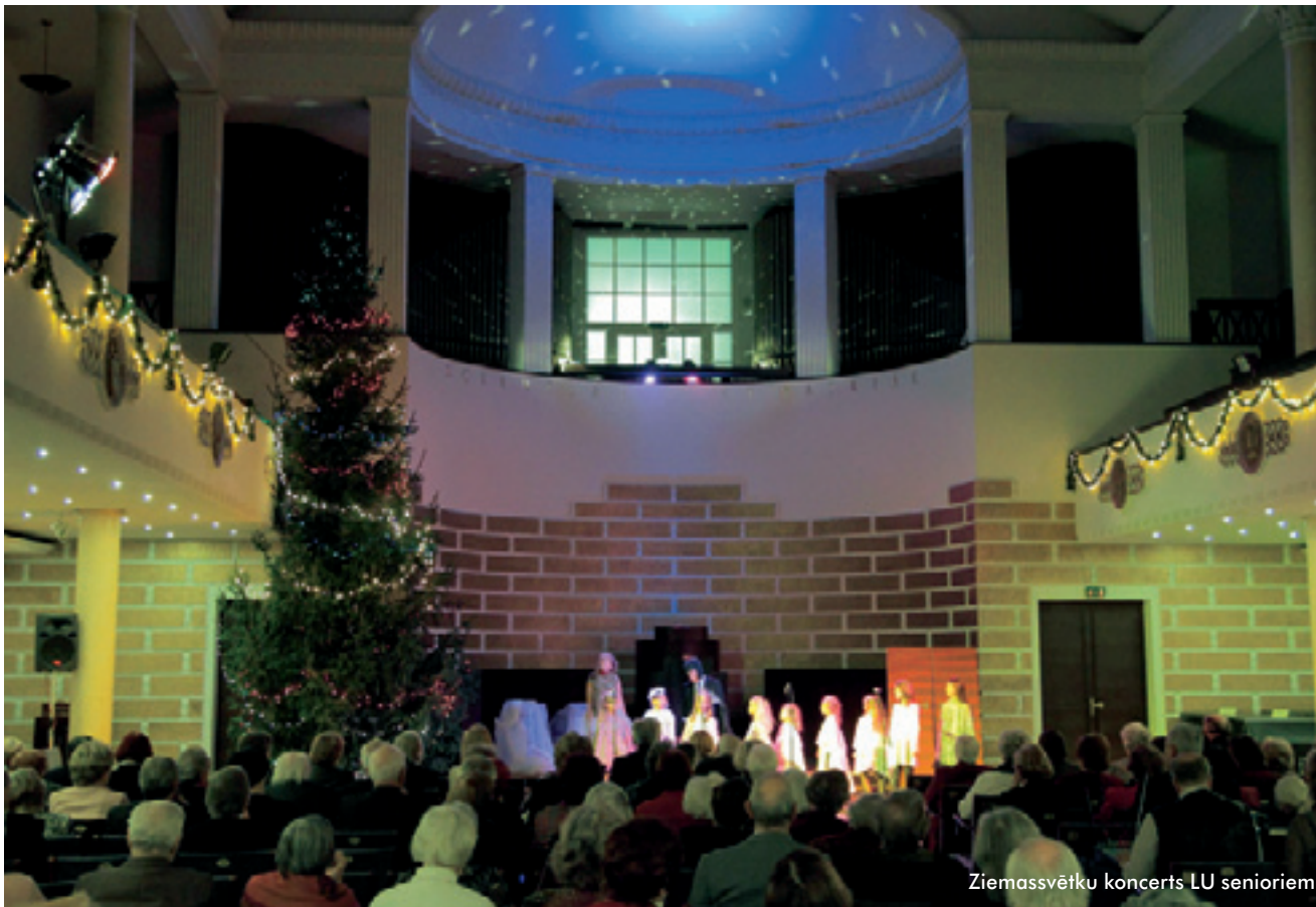
Ziemassvētku koncerts LU senioriem.