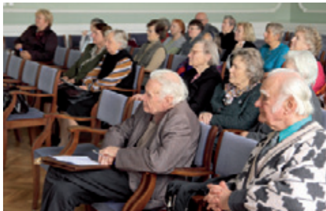
LU Senioru apvienības lekcija un diskusija «Sociālās drošības sistēmas ilgtspēja»