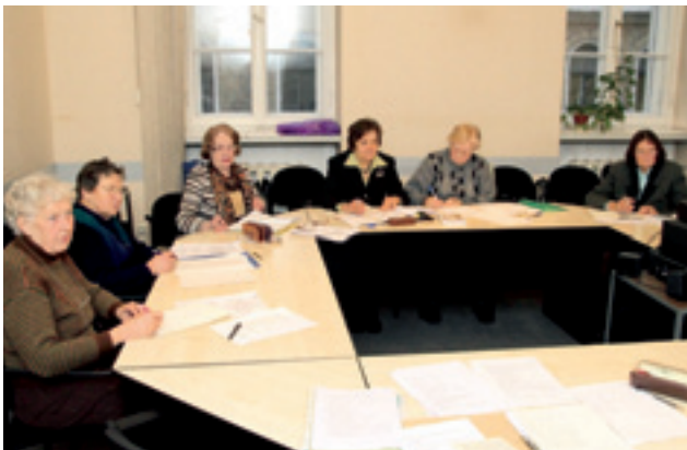
Angļu valodas nodarbība LU senioriem

privātās kolekcijās Latvijā, ASV, Vācijā, Čehijā, Slovākijā, Ungārijā, Igaunijā un Lietuvā, kā arī vairākos Latvijas muzejos.