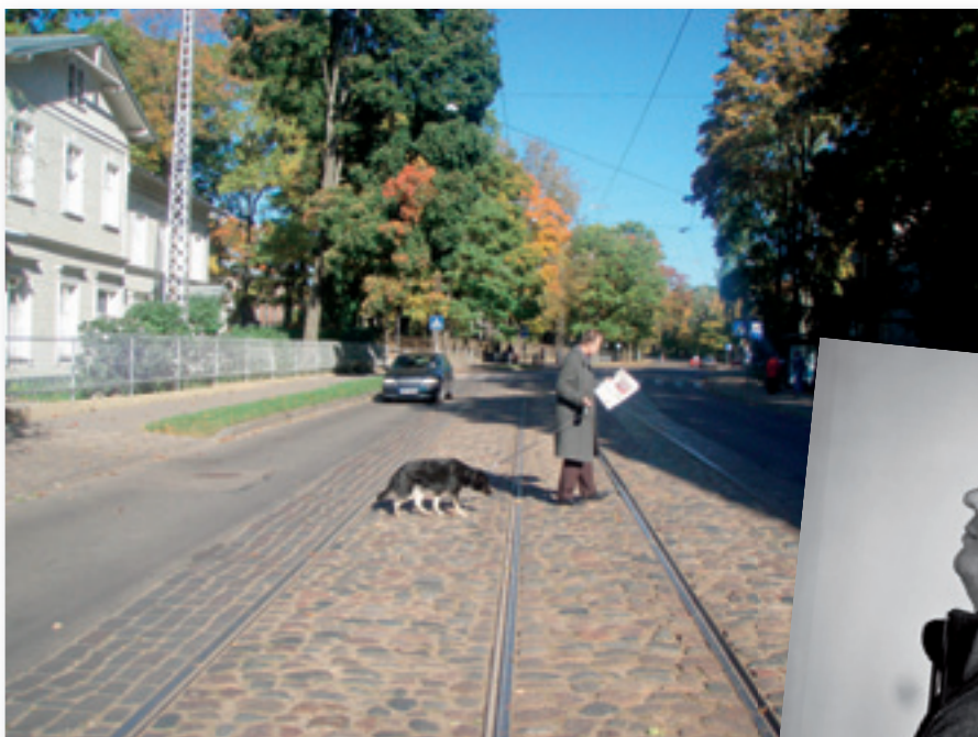
Edmunds Gross «Atkarīgie»

Galvenais kritērijs darbu vērtēšanā ir radoša un mākslinieciska pieeja, nekādu ierobežojumu vecuma, izglītības, pieredzes vai pārliecību sakarā nav.