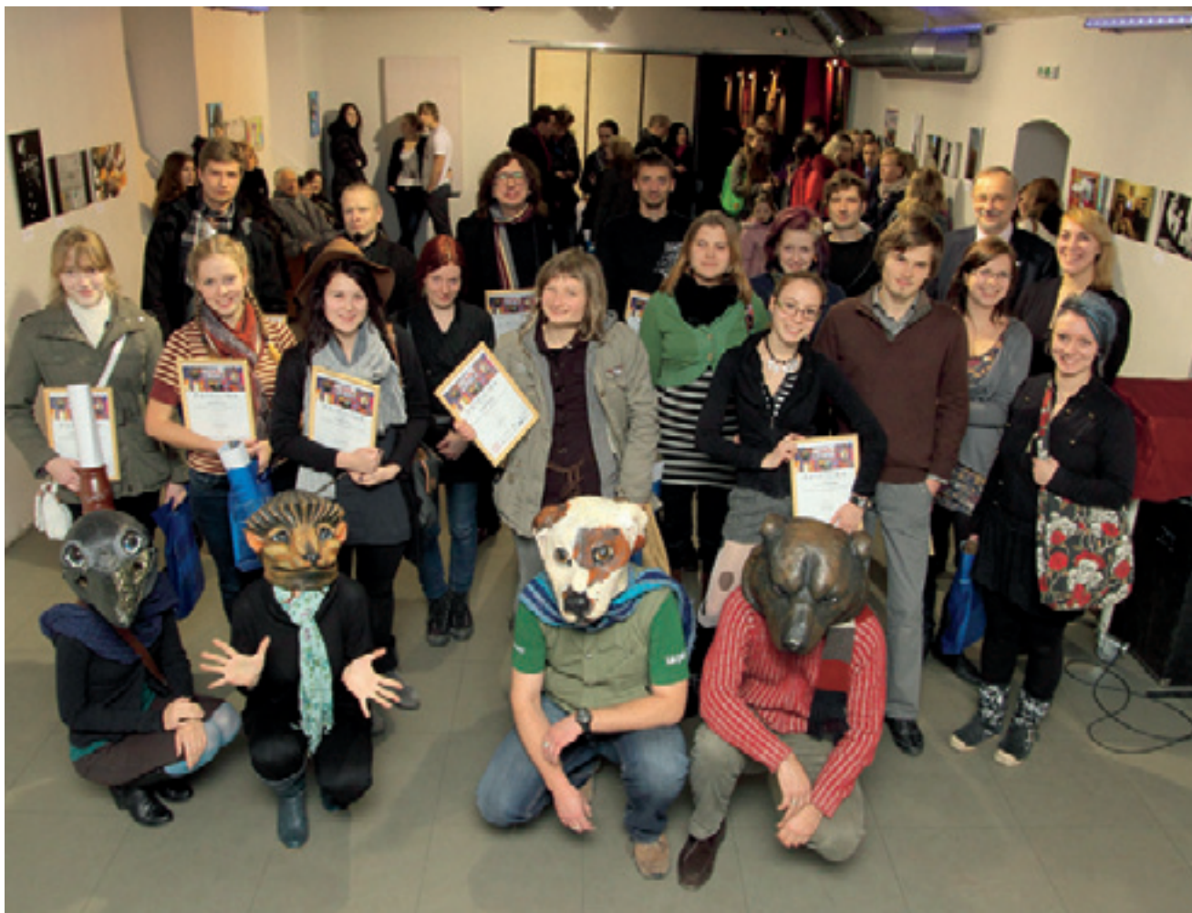
Fotokonkursa laureātu kopbilde