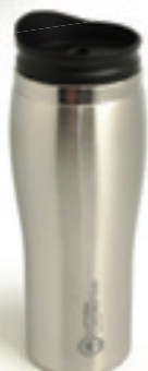
Termokrūze Ls 6,95