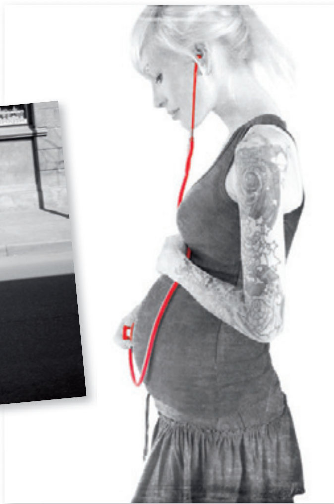
Dace Harlesden «Stāsti, kas jauns?»