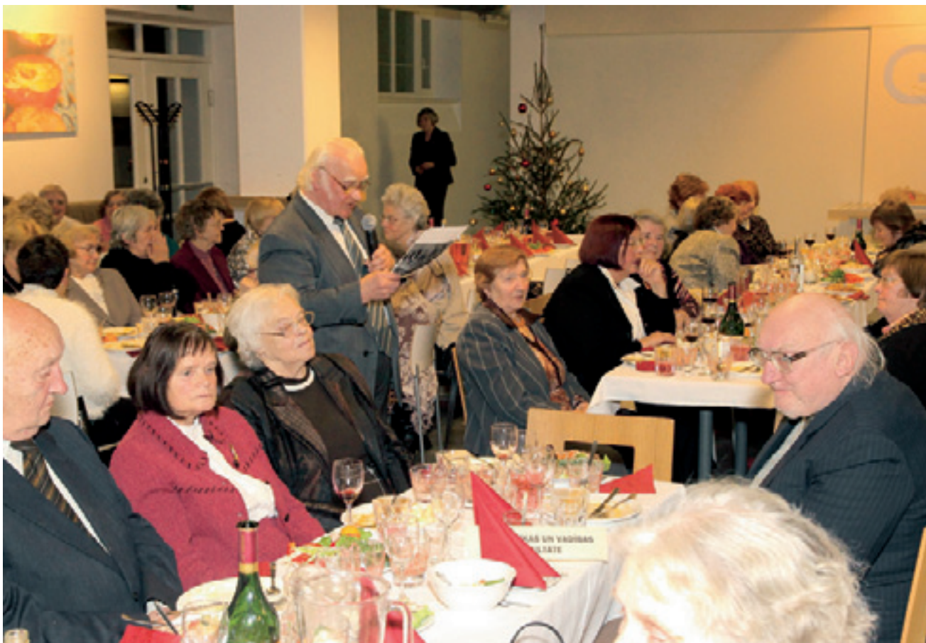
LU senioru Ziemassvētku salidojums

kolektīvam un iespēju nejusties atstumtiem, kā tas ziemžēl notiekot citās mācību iestādēs.