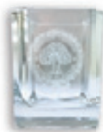
Glāze Ls 5,00

Suvenārus var iegādāties Raiņa bulvārī 19, 127. telpā