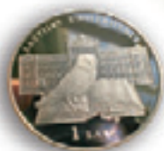
Jubilejas 1 lata monēta (sudrabs) Ls 23,18