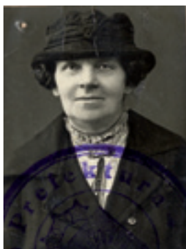
M. M. V. Petkeviča