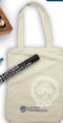
Lina auduma maisiņš Ls 4,50