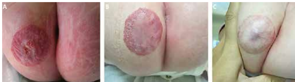
Figura 2 – Hemangioma infantil ulcerado da nádega direita em lactente com 4 meses de idade (A). Avaliação da eficácia do propranolol oral após, respetivamente, 1 mês (B) e 2 meses (C) de tratamento. É de salientar que uma acentuada melhoria da dor ocorreu apenas 1 semana após a introdução do tratamento betabloqueador.