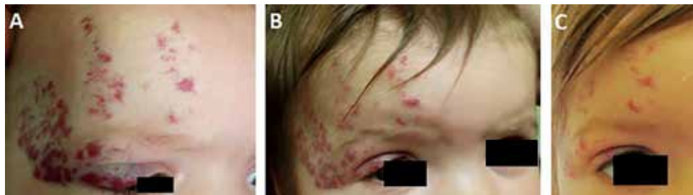
Figura 1 – Hemangioma infantil da região periocular direita em criança com 6 meses de idade (A). Avaliação da eficácia do propranolol oral após, respetivamente, 1 mês (B) e 5 meses (C) de tratamento.

As principais indicações para o tratamento do HI são: ulceração; localização com risco de compromisso visual, interferência com a alimentação ou risco de deformidade estética (ex.: nariz, pavilhão auricular, lábios...) e HI potencialmente fatal (obstrução da via aérea, localização hepática e insuficiência cardíaca de alto débito). 6 A ulceração e a localização peri-ocular são as indicações mais frequentemente responsáveis pela prescrição do tratamento betabloqueador (Figura 1-2).