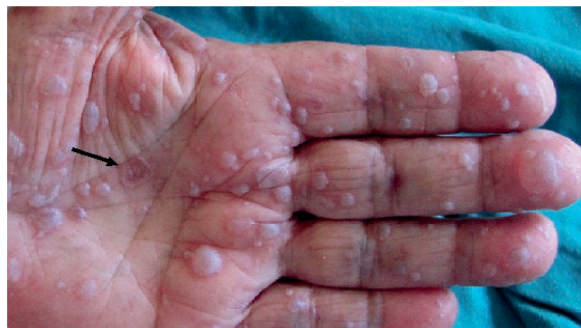
Fig 3 - Pápula eritematosa em alvo com cerca de 0.5cm e bolhas de conteúdo seroso na palma da mão esquerda.

mãos e a região perineal. Na língua e na mucosa oral, observavam-se múltiplas exulcerações (Fig. 2), tal como bolhas de conteúdo seroso ao nível das palmas e das plantas (Fig. 3). O sinal de Nikolsky era negativo.