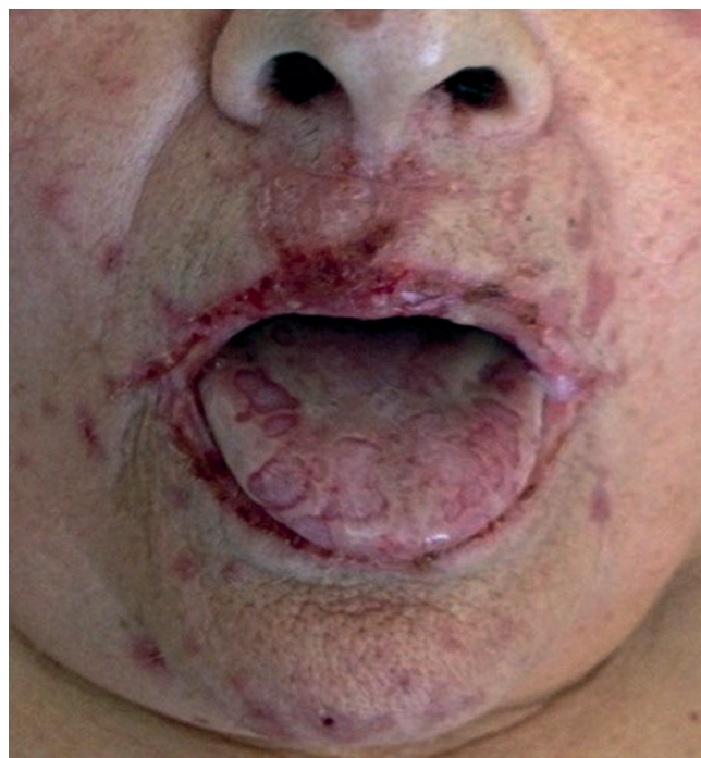
Fig 2 - Exulcerações da língua.