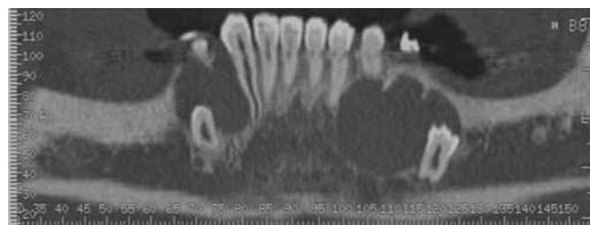
Figura 1 – Tomografia computadorizada da mandíbula, corte axial. Dois quistos em relação com dentes molares.

Referenciada à consulta de estomatologia do nosso hospital em 2011 por quistos mandibulares recidivantes (já submetida a cirurgia excisional em 2008). Realizou tomografia computadorizada da mandíbula, que revelou a presença de dois quistos em relação com dentes molares (Figura 1) pelo que se procedeu a cirurgia excisional (Figura 2). O exame anátomo-patológico revelou tratarem-se de queratocistos odontogénicos, tendo sido enca-