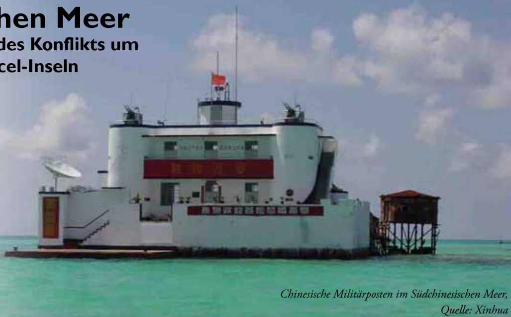
Chinesische Militärposten im Südchinesischen Meer

Die Diskussion um die Spratly Inseln taucht seit den 1970er Jahren mit der gleichen Regelmäßigkeit auf der politischen Agenda auf, wie diese Inseln aus dem Südchinesischen Meer - mit der gefährlichen Tendenz zu einem bewaffneten Konfliktaustrag. Die Bestrebung Beijings um Vormachtstellung im Südchinesischen Meer erhöht die Gefahr regionaler Konflikte und beschleunigt die Aufrüstungsspiralen in Ost- und Südostasien. Der folgende Beitrag beleuchtet den Konflikt in seinem jetzigen Stand und untersucht die Auswirkungen auf die Rüstung in den Staaten Südostasiens. Darüber hinaus sollen die Implikationen des Konfliktes auf das Verhältnis der Region zu den weiter entfernt liegenden Staaten Indien und Japan angesprochen werden, um die Bedeutung des Konfliktes für das militärische Gleichgewicht in der Region und darüber hinaus zu verdeutlichen.