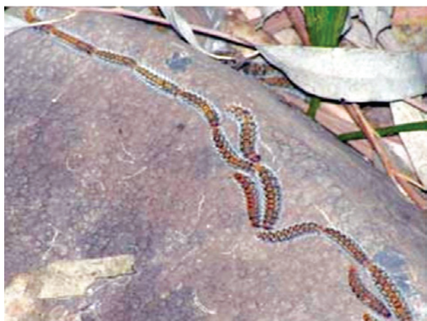
Figura 1. Fileira de Processionárias.

O diagnóstico clínico de toxicidade ocular a Processionária exige um elevado grau de suspeição e uma observação minuciosa. Embora se manifeste habitualmente como queratite ou queratoconjuntivite (e em mais de 95% destes casos com uveíte anterior aguda (3) ), são descritas outras localizações, na origem da classificação de Cadera et al. (4) :