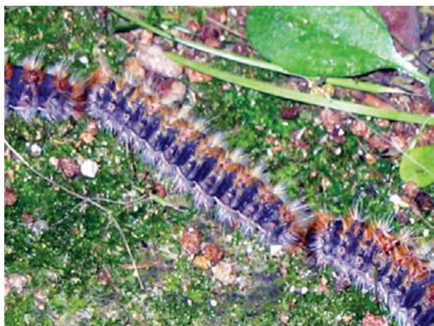
Figura 2. Processionária.