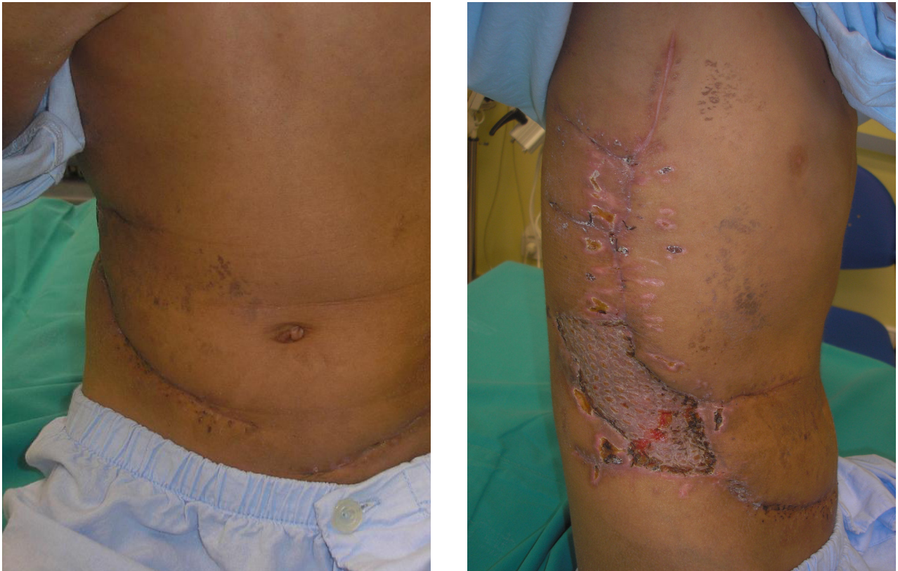
Fig. 4 - Necessidade de pequena área de enxerto dermo-epidérmico. Bom resultado estético

provavelmente devido ao desbridamento cirúrgico agressivo, antibioticoterapia, suporte ventilatório e hemodinâmicos adequados.