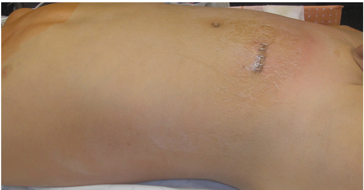
Fig. 1- Sinais inflamatórios peri-incisional com extensão bilateral até o tronco, com intensa dor local

Permaneceu 11 dias na Unidade de Cuidados Intensivos, com instabilidade hemodinâmica e necessidade de suporte inotrópico durante 8 dias e ventilação mecânica e a presença de infiltrado de células inflamatórias.