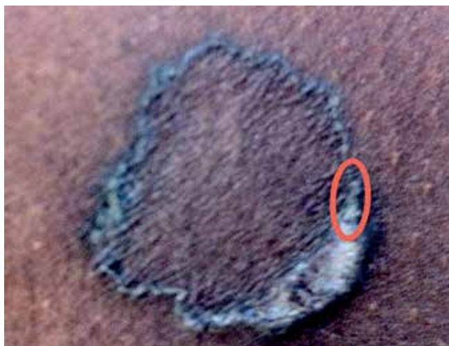
Fig 2 - Placa anular de bordo hiperqueratósico localizada à região infra-axilar esquerda esquerda (biopsia efectuada no bordo da lesão - elipse).

Os achados histológicos são muito característicos e partilhados por outras formas de poroqueratose, destacando-se no bordo das lesões, a presença da lamela cornóide, correspondendo a área de invaginação epidérmica, onde se encontra uma coluna de células paraqueratósicas, com agranulose na base da sua implantação. Na zona central da lesão observa-se diminuição da espessura da epiderme 7 . O desenvolvimento de técnicas de imagem não-invasivas, de elevada resolução como a tomografia de coerência óptica e a microscopia confocal de fluorescência permitiu a identificação in vivo da lamela cornóide 8,9 .