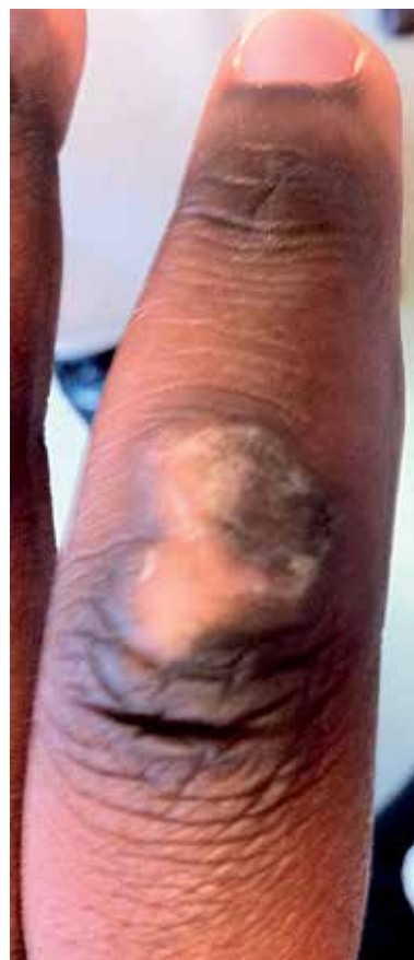
Fig. 1 - Placa anular de bordo hiperqueratósico localizada ao dorso do terceiro dedo da mão esquerda.

A PM é uma dermatose crónica e progressiva, podendo apresentar raramente remissão espontânea. Foi descrita originalmente por Vittorio Mibelli em