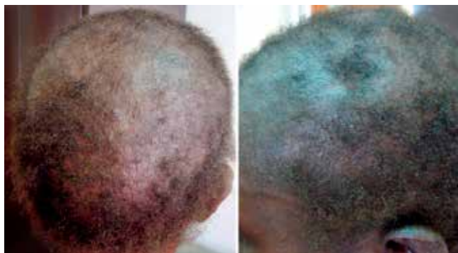
Fig 3 - Fotografias clínicas da doente do Caso 3 – tinha tricofítica.

humana (VIH) tipo 1 diagnosticada em 2000 com imuno-depressão grave, insuficiência renal crónica em hemodiálise, cardiopatia valvular com prótese mitral sob anticoagulação oral, status pós-acidente vascular cerebral hemorrágico com hemiparesia esquerda sequelar. Foi observada por múltiplas placas de alopecia irregulares com descamação associada, algumas coalescentes, distribuindo-se por todo o couro cabeludo e com envolvimento da face, com tempo de evolução desconhecido (Fig. 3). A observação com luz ultra-violeta de Wood não evidenciou fluorescência e o exame micológico cultural permitiu isolar Trichophyton (T.) soudanense .