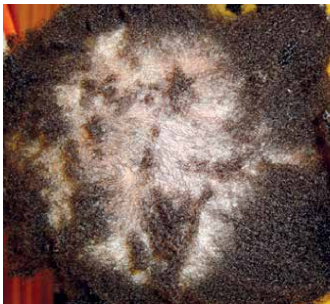
Fig 2 - Fotografias clínicas da doente do Caso 2 – tinha microspórica.

humana (VIH) tipo 1 diagnosticada em 2000 com imuno-depressão grave, insuficiência renal crónica em hemodiálise, cardiopatia valvular com prótese mitral sob anticoagulação oral, status pós-acidente vascular cerebral hemorrágico com hemiparesia esquerda sequelar. Foi observada por múltiplas placas de alopecia irregulares com descamação associada, algumas coalescentes, distribuindo-se por todo o couro cabeludo e com envolvimento da face, com tempo de evolução desconhecido (Fig. 3). A observação com luz ultra-violeta de Wood não evidenciou fluorescência e o exame micológico cultural permitiu isolar Trichophyton (T.) soudanense .