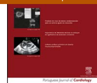
IMAGEM EM CARDIOLOGIA