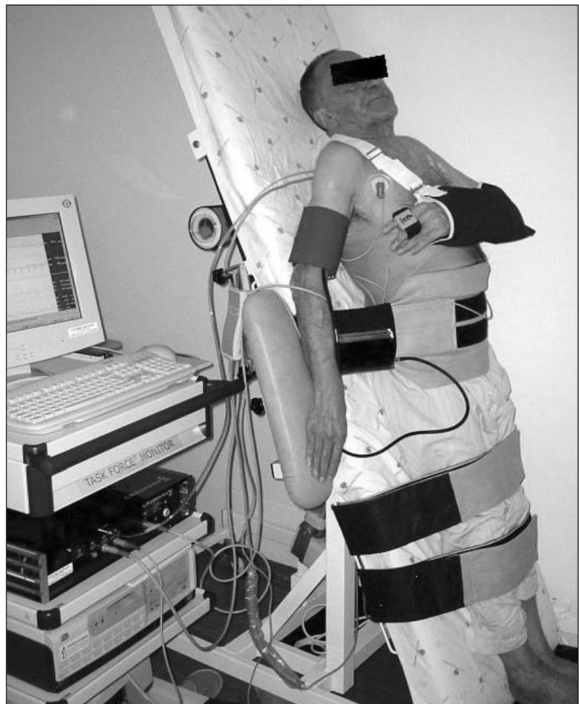
Fig. 2 Doente idoso submetido a teste de inclinação com nitratos. Monitorização contínua da pressão arterial e do electrocardiograma.

After an initial phase of stabilization in decubitus for 20 minutes, carotid sinus massage was performed; if this was negative, the table was tilted to 70° and the massage repeated. This was followed by a passive phase lasting 20 minutes. In the absence of syncope after this period, 500 mcg of sublingual nitroglycerin was administered, with an additional 20 minutes monitoring at 70°. At the end of the test, the pa-