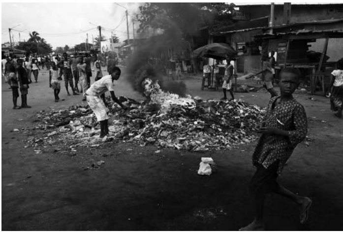
Protestkundgebungen von Ouattara-Anhängern in Abidjan.