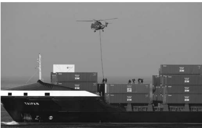
Holländische Soldaten befreien das deutsche Containerschiff „Taipan“ aus der Hand somalischer Piraten im April 2010, ein riskantes Unterfangen für Befreier und Gefangene. Meist werden stattdessen hohe Lösegeldsummen gezahlt, die in die dunklen Kanäle der internationalen Kriminalität gelangen.

Abgesehen von den rechtlichen Möglichkeiten wird der einzelne Überfall auf ein Schiff in somalischen Gewässern oder außerhalb oft nicht unmittelbar als ein Akt transnationaler organisierter Kriminalität wahrgenommen. Die transnationale Dimension von Piraterie wird jedoch deutlich, wenn auch die Taten vor und nach dem eigentlichen Überfall Berücksichtigung finden: Piraten müssen mit Waffen versorgt, der Verbleib der Schiffe in somalischen Gewässern muss organisiert, die Lösegeldverhandlungen geführt und die anteilige Zahlung des Geldes an die Beteiligten gesichert werden. Es werden auch systematisch Informationen der Schifffahrt ausgewertet, so etwa das Schiffsverzeichnis ‚Lloyd’s List‘ oder das Fachmagazin ‚Jane’s Intelligence‘. Das alles erfordert Planung, Logistik und die Möglichkeit, das Lösegeld den eigentlichen Drahtziehern dieser Überfälle zukommen zu lassen. Der eigentliche