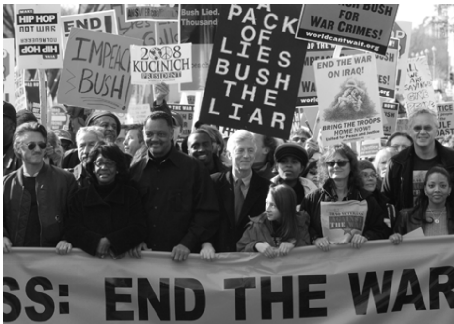
Am letzten Januar-Wochenende 2007 protestierten rund 300.000 Menschen in Washington D.C. gegen eine Fortsetzung des Irakkrieges.