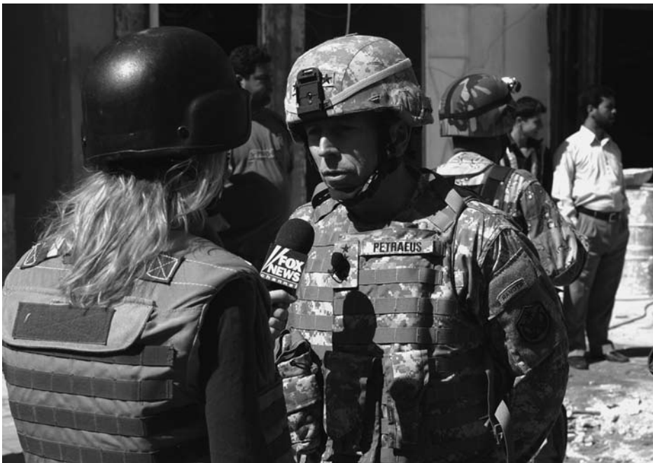
General David Petraeus wird im Irak von einer Fox News-Journalistin interviewt. In seinem Bericht im September 2007 beschrieb er die Sicherheitslage im Irak als insgesamt verbessert, trotz „verbleibender Schwierigkeiten“, und warnte ebenso wie US-Botschafter Ryan Crocker vor den Folgen eines sofortigen Rückzuges.

zung zur Irakstrategie bis September aufgeschoben konnte.