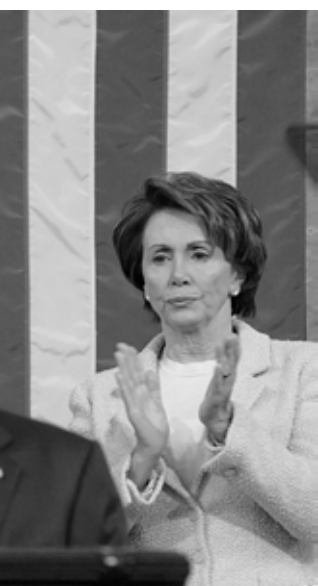
am 23. Januar 2007. Hinter ihm sitzen Vize-Vize-Pelosi. Bild: picture-alliance

Quelle: Pew Research Center for the Public and the Press