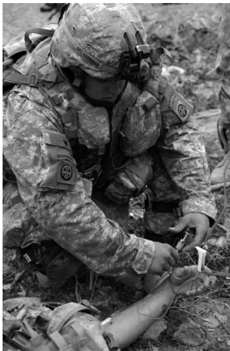
Seit Kriegsbeginn im März 2003 starben bis Ende Februar 2008 im Irak fast 4000 US-Soldaten, etwa 30 000 wurden verwundet.

Auf den ersten Blick scheint das repräsentative Demokratiemodell der USA, dessen Kernstück die Idee „Alle Macht geht vom Volke aus“ bildet, die Voraussetzungen zu erfüllen, dass eine vom Gros der Bevölkerung sowie der Mehrheit der Legislative getragene Forderung sich in eine politische Entscheidung umsetzen lässt. Der Präsident genießt im präsidentialen Demokratiesystem zwar Privilegien, aber eines der wichtigsten Ziele der Verfassungsväter war es, in Abgrenzung zum damals feudalen Europa, die Möglichkeit einer Alleinherrschaft des Staatsoberhaupts über das Volk zu verhindern. Zugleich waren sie besorgt, dass die gewählten Repräsentanten des Volkes im Namen des „allgemeinen Volkswillens“ die Interessen des Individuums missbrauchen und eine Zentralisierung staatlicher Macht entstehen könnte. Um die Freiheit des Einzelnen und Minderheiten vor einer „Tyrannei der Mehrheit“ zu schützen sowie eine Machtkonzentration zu verhindern, verankerten die Gründerväter im politischen System der USA in Anlehnung