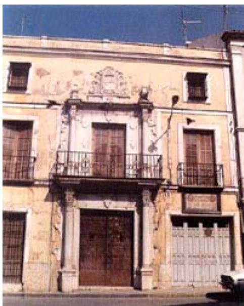
Casa natal de Valera en la antigua calle San Martín, hoy de Juan Ulloa, en Cabra, Córdoba.

Juan Valera es para el lector común de hoy día uno de los novelistas españoles del siglo XIX más famosos y para los lectores exigentes está emergiendo la figura del impresionante escritor de cartas familiares en las que fue registrando su vida personal y muchos aspectos de la vida española durante más de cincuenta años. Puede parecer extraño calificarle como "polígrafo" – un adjetivo que según los usos retóricos establecidos sólo conviene a su amigo el "polígrafo santanderino" Menéndez Pelayo– y, sin embargo, tal caracterización es la que admitirían con menor esfuerzo los lectores contemporáneos suyos. Él mismo se presentó ante sus lectores en más de una ocasión como un escritor promiscuo que alternaba el cultivo de los géneros literarios, no se sabe muy bien si