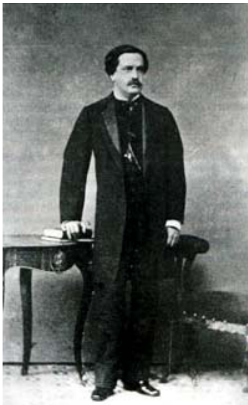
Un joven Juan Valera vestido a la última moda.

y el progreso de España, tanto en su mirada hacia el pasado como en la visión del futuro. España y su Historia fueron preocupación constante en nuestro escritor y muchos de sus trabajos periodísticos resultan ser un entrecruzado de observaciones suyas proyectadas al mismo tiempo sobre el acontecer hispano de otros tiempos y sobre los sucesos infelices que aquejaban a los españoles del siglo XIX.