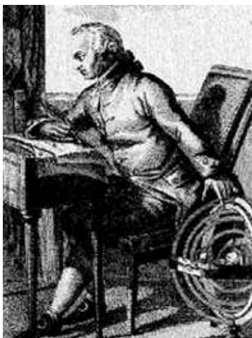
Kant, una influencia del joven Juan Valera.

"La ciencia –escribe en este texto de 1890- no ha venido a achicarlo todo, como pretende y deplora Leopardi, sino a hacer más ingente, más hermoso, más rico y más vario el panorama del espíritu".